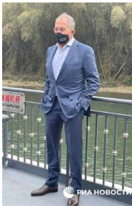
Außenminister Sergey Lavrov posiert mit einer Maske, auf der „FCKNG QRNTN“ steht.

Aber auch das ist nicht der wahre Grund, denn der Westen hasste Putin schon lange vor COVID.