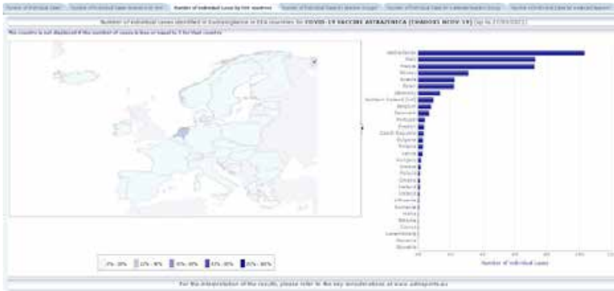
Übersicht der Fälle von Nebenwirkungen nach Ländern aufgeschlüsselt, die in EudraVigilance für Covid-19 Impfstoff AstraZeneca, per 27.03.2021, festgestellt wurden.

(siehe D.W., Ausg. 41, S.3 [12]). Das ist deutlich höher als bei allen mir bekannten Fallzahlen der klassischen Impfstoffe der letzten Jahrzehnte.