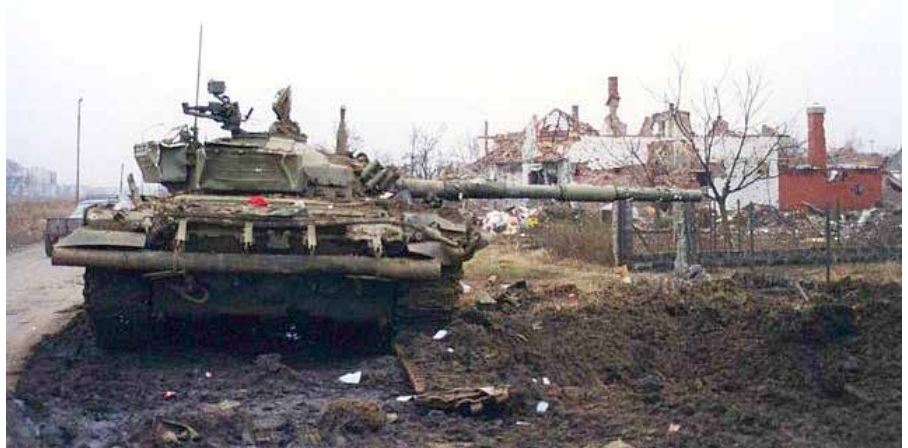
Panzer JNA M-84 zerstört durch eine von kroatischen Soldaten in Vukovar verlegte Mine im November 1991.

Womit Fischer seinem FDP-Kollegen endlich das fällige Stichwort geliefert hat. Als befände er sich nicht im post-modernen Spiegel-Tempel, sondern in einer BDSM-Session, springt die männliche Domina Lambsdorff wie von der Tarantel gestochen auf und holt nun die Lederpeitsche aus der Folterkammer: „Wir müssen deutlich machen, dass die aktuell ja sehr zurückhaltende Sanktionspolitik der Nadelstiche gegen einzel-