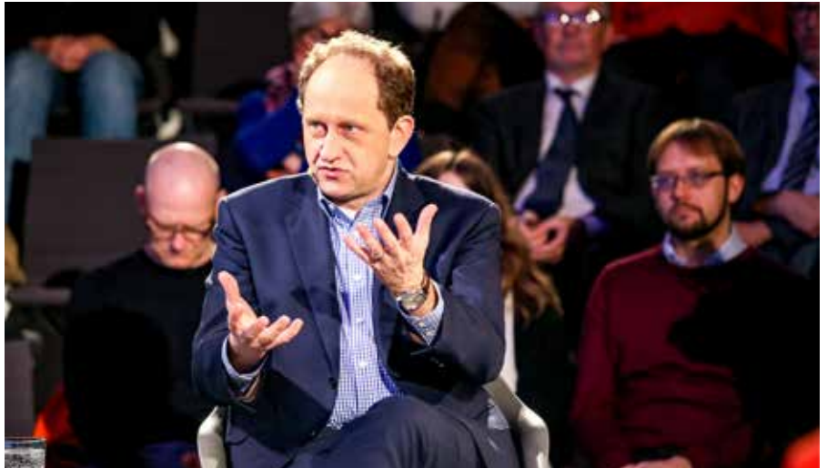
Alexander Graf Lambsdorff ist ein deutscher Politiker und Diplomat. Von 2001 bis 2019 gehörte er dem Bundesvorstand seiner Partei an, von 2004 bis 2017 war er Mitglied des Europäischen Parlaments und dort Vorsitzender der FDP-Gruppe.

Dabei hätten die gewieften Spiegel-Leute nur die Homepage der „Seventh United States Army Europe and Afrika“ (USAREUR), Hauptquartier in Wiesbaden, konsultieren müssen. Dort steht in einer Pressemitteilung[4] vom 15. März diesen Jahres schwarz auf weiß: „Defender Europe 2021 demonstriert unsere Fähigkeit, als strategischer Sicherheitspartner auf dem westlichen Balkan und im Schwarzen Meer zu fungieren und gleichzeitig unsere Fähigkeiten in Nordeuropa, im Kaukasus, in der Ukraine und in Afrika zu erhalten.“ Gemeinsam sei man in