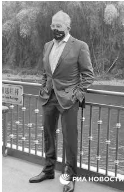
Außenminister Sergey Lavrov posiert mit einer Maske, auf der „FCKNG QRNTN“ steht.

Aber auch das ist nicht der wahre Grund, denn der Westen hasste Putin schon lange vor COVID.