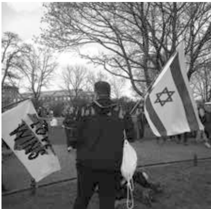
Friedlich Flagge zeigen

Angekommen am Schloss Bellevue, war die Stimmung zunächst wieder relativ friedlich. „Die Basis“ hatte die Veranstaltung angemeldet und sie war wohl auch ohne Probleme genehmigt worden.