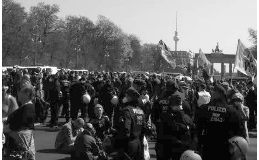
Maskenkontrolle in Sichtweite zum Brandenburger Tor am 21. April 2021