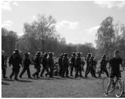
Berliner Einsatzhundertschaft im Park unterwegs

Unsere ganze Gruppe wusste eigentlich nicht mehr, was sie machen sollte, nachdem die Kundgebungen am „17. Juni“ aufgelöst worden waren. Also folgten wir dem Pulk Richtung Ausgang Holocaust-Mahnmal. Die meisten zogen allerdings über die Straße in Richtung Alexanderplatz – auf dem Weg, auf dem wir morgens gekommen waren. Aber da wir an der Straßenecke auf der anderen Seite unsere „Freunde“ von der „33er“-Einheit stehen sahen und die Straße keine Fluchtwege bot, zogen wir es vor, beim Park zu bleiben. Das roch nicht nur nach Kessel, das war wohl einer, denn ganz überraschend kam der Zug auch zum Stehen. Unsere Entschei-