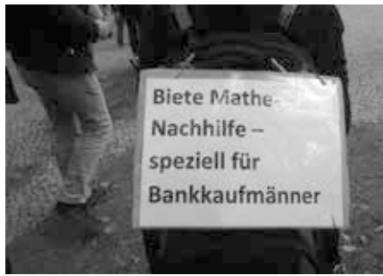
Friedlicher Protest mit kreativer Botschaft

Die Ordner versuchten unterdessen, die Teilnehmer auf Abstandspflicht und Maskennutzung hinzuweisen, um einen vorzeitigen Abbruch bzw. Fehlstart zu verhindern, aber ihre Bemühungen wurden aktiv durch Demonstranten unterlaufen, die mit