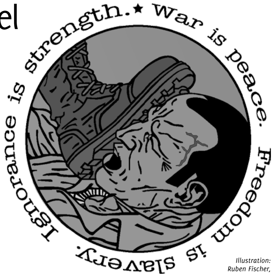
Illustration: Ruben Fischer, Free21, CC BY-NC-ND 4.0

Es ist viel passiert in letzter Zeit. Im täglichen Informationsrausch es ist unmöglich, den Überblick über all das zu behalten, was vor sich geht. Daher werde ich hier meine Gedanken zu ein paar der Dinge schreiben, die passiert bisher sind.