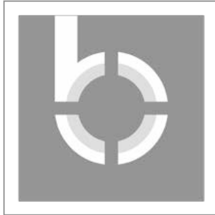
Gegen Mykola Slochevsky und Burisma liefen in der Ukraine bis zu 14 Strafverfahren, bis der Generalstaatsanwalt Shochin durch Jurij Lutsenko ersetzt wurde. (Bild: Svetlana Pashko / Wikipedia.org / CC BY-SA 4.0) (Logo: Burisma Holdings / Wikipedia.org / CCo)

fluss zum Vorteil von Hunter und seinen ukrainischen Geschäftspartnern nutzte und es zuließ, dass sein Name während seiner Amtszeit als Vizepräsident vom Sohn und dem Bruder benutzt wurde, um Geschäftsmöglichkeiten in China zu verfolgen. Fragen, auf die eine wenigstens notdürftig funktionierende Presse-landschaft Antworten suchen müsste – unabhängig davon, wie viele ähnliche oder schlimmere Skandale die Trump-Familie hat.