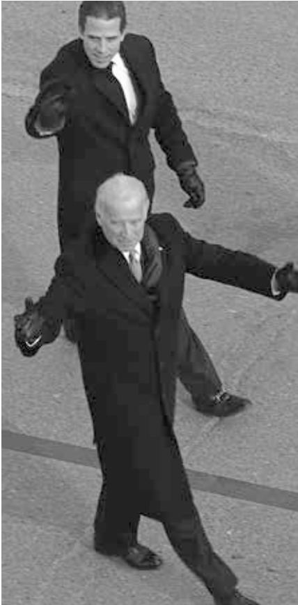
Joe Biden mit seinem Sohn Hunter Biden.

Rudy Giuliani übergeben konnte. Der Eigentümer der Werkstatt bestätigte dies in Interviews mit Nachrichtenagenturen [10] und später (bei drohender Strafverfolgung durch Falschaussagen) auch vor einem Senatsausschuss [11]. Außerdem legte er den angeblich von Hunter unterzeichneten Reparaturauftrag vor. Weder Hunter noch die Biden-Kampagne haben diese Behauptungen bestritten.