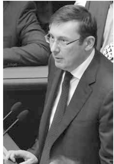
In der Ukraine ernannt Poroschenko Jurij Lutsenko, einen Verbündeten, ohne juristische Erfahrung, zum Generalstaatsanwalt.

Wenn darüber hinaus die Vergrößerung der Unabhängigkeit der Staatsanwaltschaft und die Stärkung der Wachsamkeit bei der Korruptionsbekämpfung wirklich Bidens Ziel gewesen wäre, als er sich für die Entlassung des ukrainischen Chefanklägers einsetzte, wie konnte dann der Nachfolger von Schochin, Jurij Lutsenko, überhaupt in Frage kommen? Lutsenko hatte schließlich „keinen juristischen Hintergrund als Generalstaatsanwalt“, war im Prinzip nur als Lakai des ukrainischen Präsidenten Petro Poroschenko bekannt, wurde 2009 gezwungen, „als Innenminister zurückzutreten, nachdem er von der Polizei am Frankfurter Flughafen wegen Trunkenheit und Ordnungswidrigkeit fest-