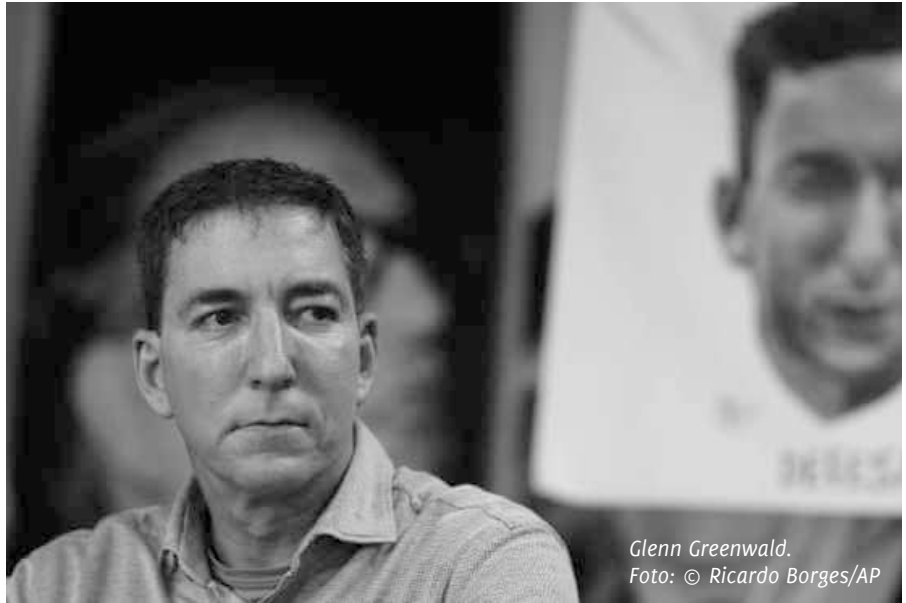
Glenn Greenwald.