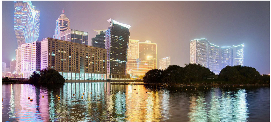
Macau ist eine etwa 50 Kilometer westlich von Hongkong gelegene Sonderverwaltungszone der Volksrepublik China.

Eine Messe der Sicherheitsbranche im Jahr 2016 in Las Vegas auf der Sands Expo bot Adelsons Unternehmen - und