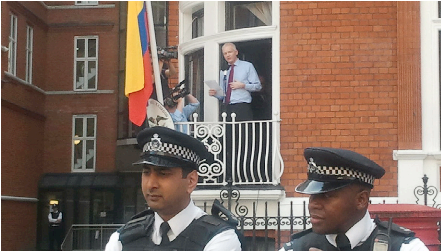
Julian Assange spricht am 19.08.2012 auf dem Balkon der ecuadorianischen Botschaft in London.

te, als „Hüter“ von Assange lukrative neue Jobs aufzutreiben. Einige Tage später kehrte er mit spannenden Neuigkeiten nach Jerez de Frontera, dem Hauptsitz seines Unternehmens in Spanien, zurück.