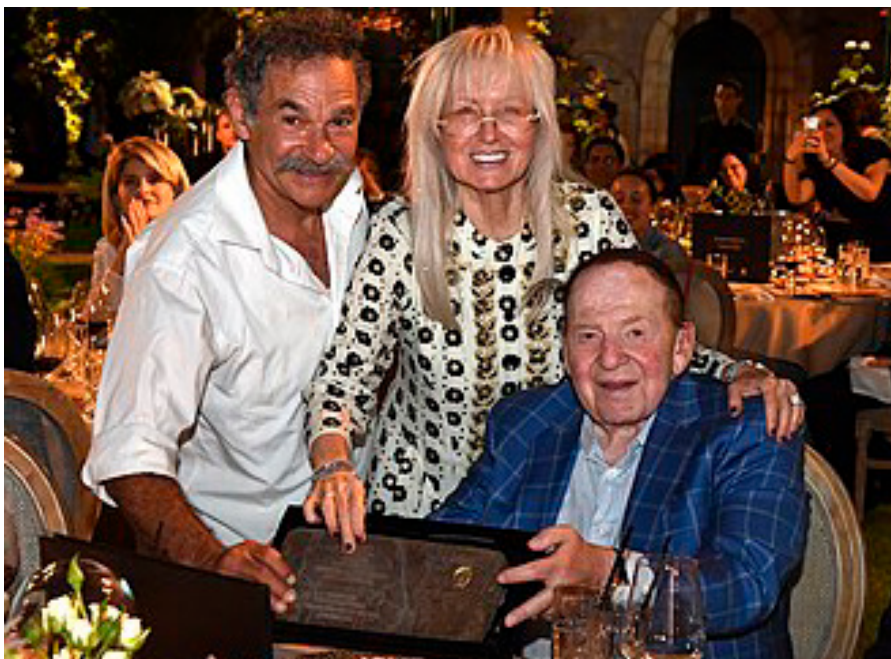
Sheldon Gary Adelson war ein US-amerikanischer Unternehmer, der sein Vermögen vor allem in der Immobilienbranche in Las Vegas verdient hat. Er war Besitzer der Las-Vegas-Sands-Gruppe.

Als der von Adelson favorisierte Kandidat, Donald Trump, ins Oval Office einzog, geriet die CIA unter die Kontrolle von Mike Pompeo, einem weiteren Verbündeten Adelsons, der die Gelegenheit zu genießen schien, im Namen der nati-