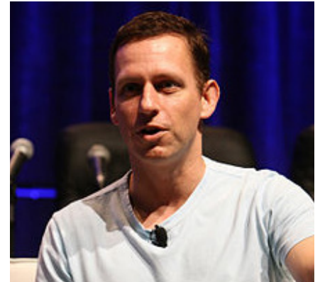
Vier der fünf Gründer waren früher bei PayPal tätig. Gründer und Chairman von Palantir ist Peter Thiel.

„Es gibt viele Dinge bei Warp Speed, die besorgniserregend sind. Vor kurzem habe ich gelesen, dass die zwei großen