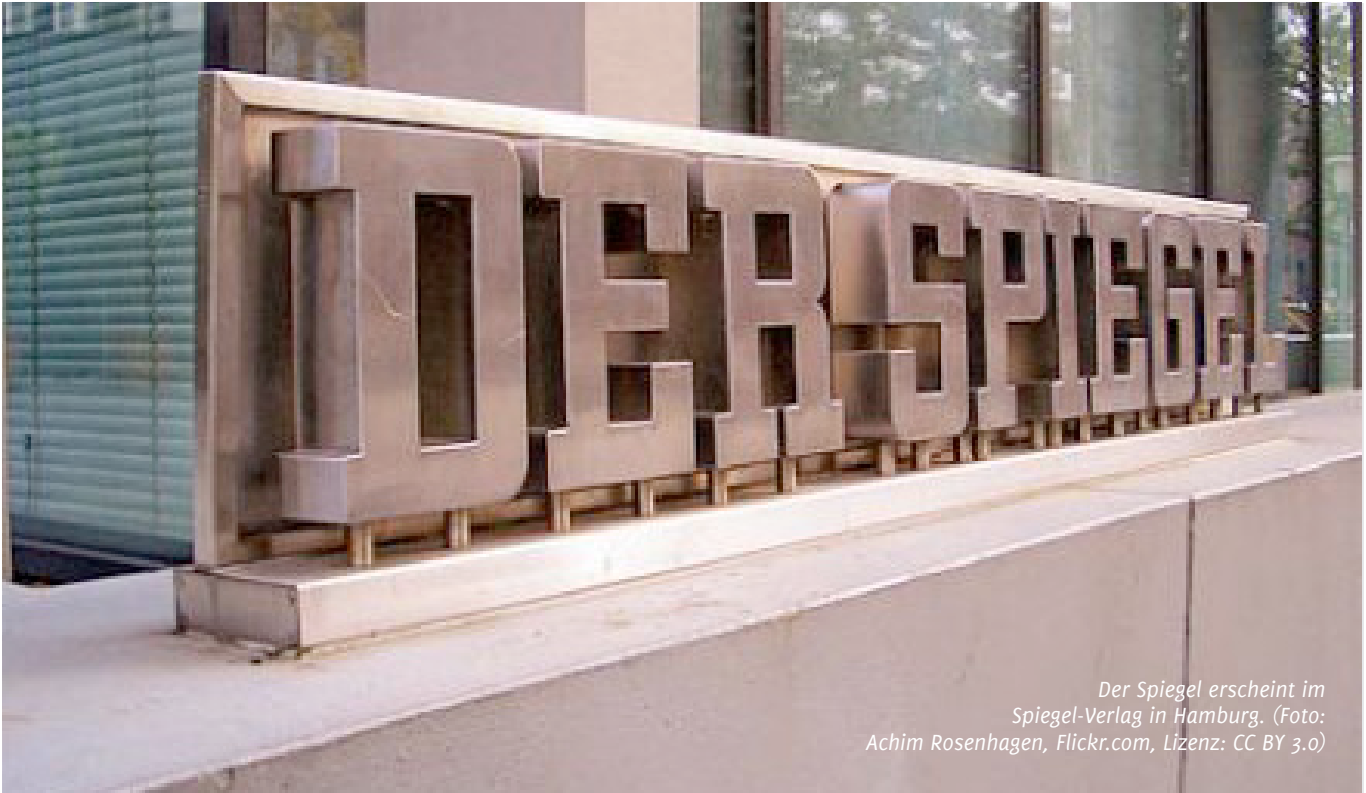
Der Spiegel erscheint im Spiegel-Verlag in Hamburg.