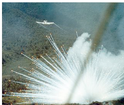
Eine Phosphorbombe enthält ein Gemisch aus weißem Phosphor und Kautschuk und wird als Brandbombe und als Nebelkampfstoff eingesetzt. Quelle: https://de.wikipedia.org/wiki/Phosphorbombe . (Foto: Wikipedia Lizenz: Public Domain)

Und in der Tat: Das Verhalten des NATO-Mitglieds Türkei, treibende Kraft im Krieg Aserbaidschans gegen – pardon: „bei der Rückeroberung der überwiegend armenisch besiedelten Enklave“ – Bergkarabach, kann nicht anders als schäbig