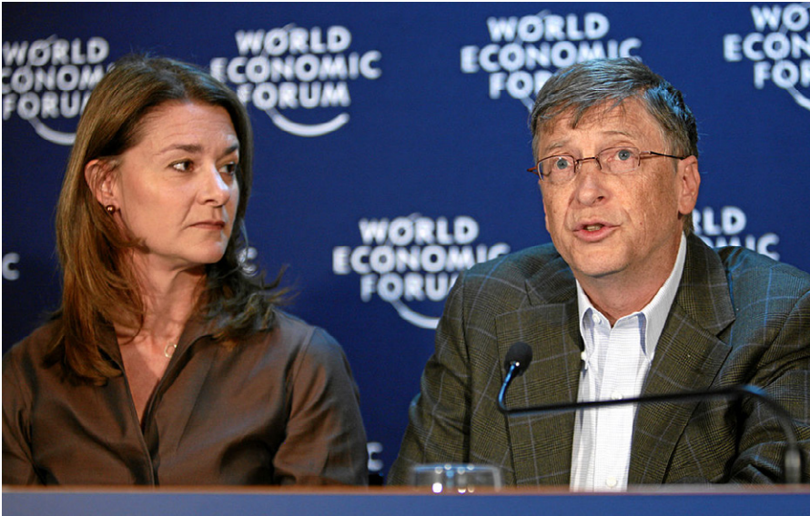
DAVOS-KLOSTERS/SCHWEIZ, 30. JAN09 – Melinda French Gates und Bill Gates sprechen während der Pressekonferenz der «Gates Foundation» an der Jahrestagung 2009 des Weltwirtschaftsforums in Davos, Schweiz, 30. Januar 2009.

mobiliare italiano, zur Unterstützung der Unternehmen ins Leben rief.