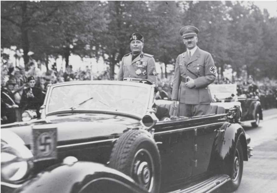
Italiens Regierungschef in Berlin. Des Führers und des Duce triumphale Fahrt durch Berlins Feststrasse. Quelle: commons.wikimedia.org, Foto: Wikimedia / Bundesarchiv Lizenz: CC BY-SA 3.0 DE

Robotern in unserem Privat- und Berufsleben vorantreiben wird.“ [14]