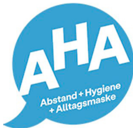
AHA-Regel inzwischen erweitert um +A, +L und -3G, als dauerhafte Verhaltensregeln? Quelle: www.bundesregierung.de, Foto: Bundesregierung, Lizenz: Gemeinfrei

Aber offensichtlich hat die ganze Publicity für Greta Thunberg und die von der Grossindustrie unterstützte „Extinction Rebellion“ [22] nicht genug öffentliche Panik ausgelöst, um solche Massnahmen zu rechtfertigen.