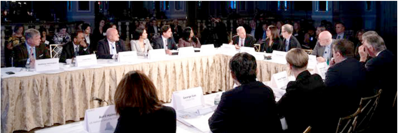
Am 18. Oktober 2019 fand in New York eine umfangreiche Pandemie-Simulation mit dem Namen „Event 201“ statt.

Schwab erklärt, dass seine „agile Governance“ die Schaffung so genannter Policy Labs – „geschützte Räume innerhalb der Regierung mit dem ausdrücklichen Mandat, mit neuen Methoden der Politikentwicklung unter Verwendung agiler Prinzipien zu experimentieren“ – und „die Förderung der Zusammenarbeit zwischen Regierungen und Unternehmen zur Schaffung von ‚Entwicklungs-Sandboxen‘ und ‚experimentellen Testbeds‘ zur Entwicklung von Regelungen unter Verwendung iterativer, sektorübergreifender und flexibler Ansätze“ [10] umfassen würde.