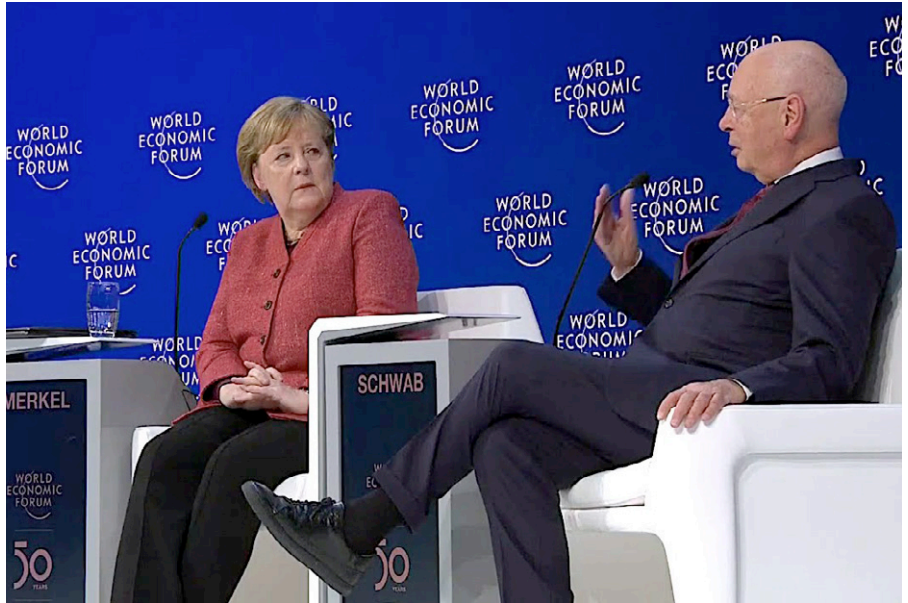
Merkel mit WEF-Gründer Professor Schwab.

Dieser Text wurde zuerst am 12.10.2020 auf www.off-guardian.org/ unter der URL < https://off-guardian.org/2020/10/12/klaus-schwab-his-great-fascist-reset/ > veröffentlicht. Lizenz: © Paul Cudeneac, WinterOak.org