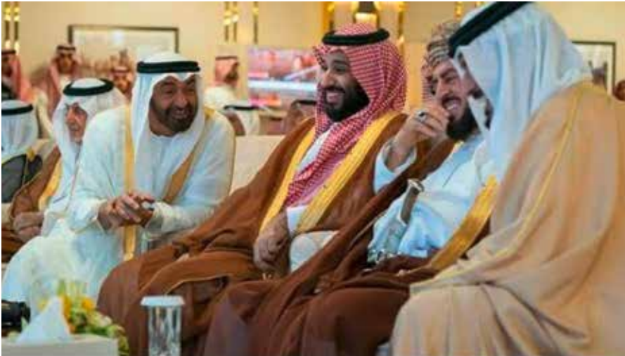
Mohammed bin Zayed (MBZ), Kronprinz von Abu Dhabi und stellvertretender Oberbefehlshaber der Streitkräfte der Vereinigten Arabischen Emirate, links und Kronprinz von Saudi Arabien Mohammed bin Salman (MBS), rechts. Gemeinsam halfen sie dem ägyptischen Militär, den gewählten islamistischen Präsidenten des Landes im Jahr 2013 abzusetzen. Außerdem unterstützte MBZ den saudischen Krieg im Yemen.

MBZ versuchte einen ehrgeizigen Traum zu verwirklichen: „einen Staat zu bauen, der die gesamte islamistische Bewegung vorführt, indem er dort Erfolg hat, wo diese versagt hatte. Anstatt einer illiberalen Demokratie – wie in der Türkei – wollte er ihr Gegenteil aufbauen: Eine sozialliberale Autokratie, ähnlich wie es Lee Kuan Yew in den 1960er und 1970er Jahren in Singapur tat.“ Es gab für ihn nur zwei Möglichkeiten: Repression oder Katastrophe. Er wählte die Repression: „Es ist ‚Kulturkrieg‘“, sagte er. [11]