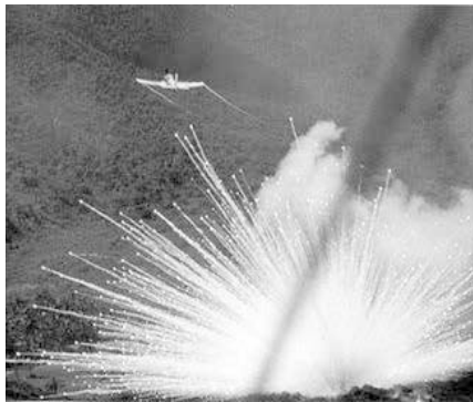
Eine Phosphorbombe enthält ein Gemisch aus weißem Phosphor und Kautschuk und wird als Brandbombe und als Nebelkampfstoff eingesetzt.

Und in der Tat: Das Verhalten des NATO-Mitglieds Türkei, treibende Kraft im Krieg Aserbaidschans gegen – pardon: „bei der Rückeroberung der überwiegend armenisch besiedelten Enklave“ – Bergkarabach, kann nicht anders als schäbig