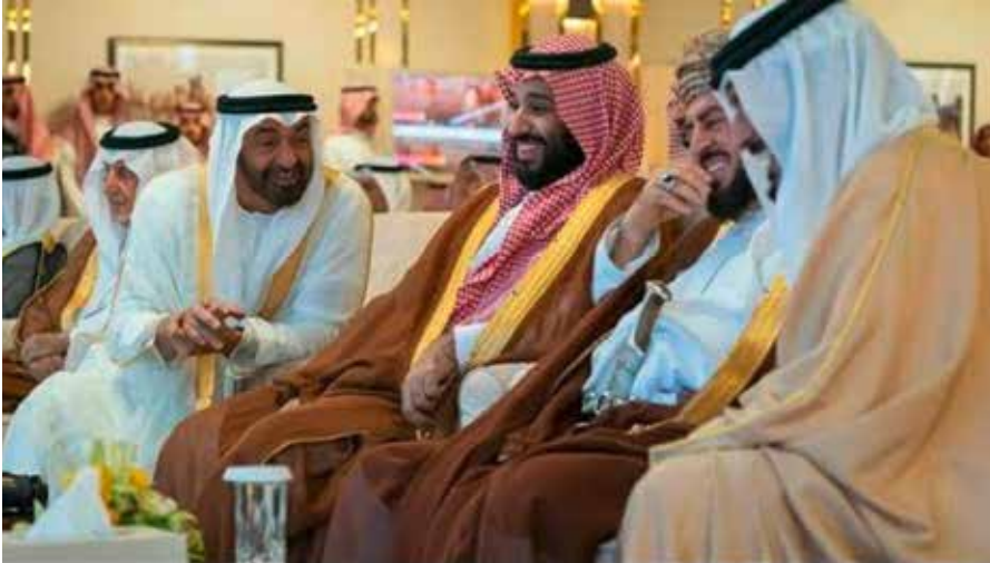
Mohammed bin Zayed (MBZ), Kronprinz von Abu Dhabi und stellvertretender Oberbefehlshaber der Streitkräfte der Vereinigten Arabischen Emirate, links und Kronprinz von Saudi Arabien Mohammed bin Salman (MBS), rechts. Gemeinsam halfen sie dem ägyptischen Militär, den gewählten islamistischen Präsidenten des Landes im Jahr 2013 abzusetzen. Außerdem unterstützte MBZ den saudischen Krieg im Yemen.

MBZ versuchte einen ehrgeizigen Traum zu verwirklichen: „einen Staat zu bauen, der die gesamte islamistische Bewegung vorführt, indem er dort Erfolg hat, wo diese versagt hatte. Anstatt einer illiberalen Demokratie – wie in der Türkei – wollte er ihr Gegenteil aufbauen: Eine sozialliberale Autokratie, ähnlich wie es Lee Kuan Yew in den 1960er und 1970er Jahren in Singapur tat.“ Es gab für ihn nur zwei Möglichkeiten: Repression oder Katastrophe. Er wählte die Repression: „Es ist ‚Kulturkrieg‘“, sagte er. [11]