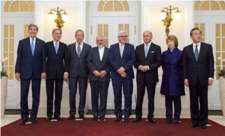
Unterzeichner des Nuklearvertrages JCPOA mit dem Iran bei der Verkündung in Wien. Von links nach rechts: John Kerry USA, Philip Hammond Großbritannien, Sergey Lavrov Russland, Javad Zarif Iran, Frank-Walter Steinmeier Deutschland, Laurent Fabius Frankreich, Baroness Catherine Ashton EU, und Wang Yi China

in den letzten vier Jahren auf die „Große Gefahr“ (vermeintliche Atomwaffen) konzentrierte, hat der Iran in aller Stille einen konventionellen, „intelligenten“ und für ein Radar praktisch unsichtbaren „Schwarm“ bzw. „Ameisenstock“ an Mikro-Waffen aufgebaut, die über den Krisengebieten kreisen – von Gaza über Libanon, Syrien und den Irak bis zum Jemen.