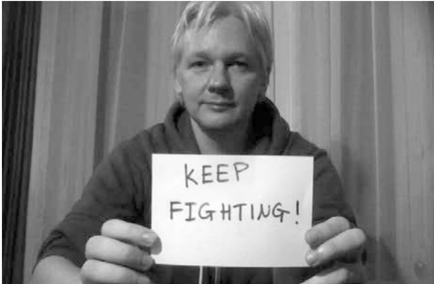
Titelbild: Julian_keep fighting.jpeg