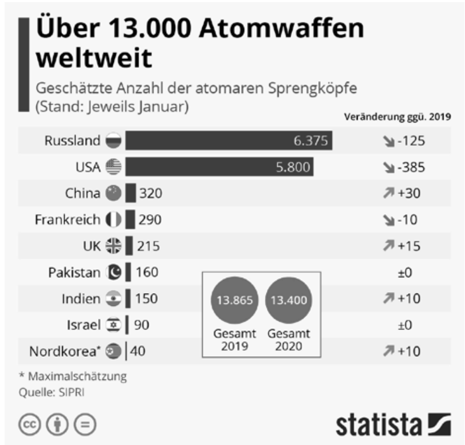
Anzahl der Atomsprengköpfe weltweit (geschätzt).

Wenn die USA versuchten, ihre Lagerbestände an Atomwaffen wie kürzlich vorgeschlagen zu erweitern, und dann 7.000 Atomwaffen ohne jegliche Unfälle einsetzen würden, würden mindestens 5 Millionen Amerikaner verhungern. Diese Analyse ist hinsichtlich der tatsächlichen Anzahl toter Amerikaner erheblich untertrieben, da wir von einer starken Rationierung von Lebensmitteln ausgehen, die die meisten Leute am Leben erhält, wenn bei dieser Lebensmittelknappheit keine anderen Nahrungsmittel zur Verfügung [16] stehen.