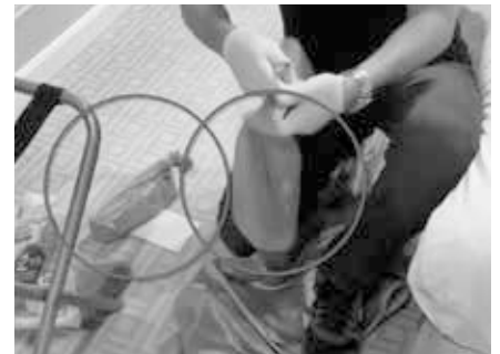
Das Nawalny-Team nahm Wasserflaschen aus dem Hotel mit, um sie später nach Deutschland zu schmuggeln.

Im Hinblick auf die letzten Erkenntnisse über die sogenannten „Nowitschok-Flaschen“ [4] und ihren Schmuggel [5] nach Deutschland interessiert die Ermittler auch, welche persönliche Gegenstände von Herrn Nawalny wann und wo konfisziert wurden. Waren sie mit dem besagten Giftstoff kontaminiert, sollten alle Informationen zur chemischen Formel und die Ergebnisse der durchgeführten Spektralanalyse mitgeteilt werden, so die Ermittler.