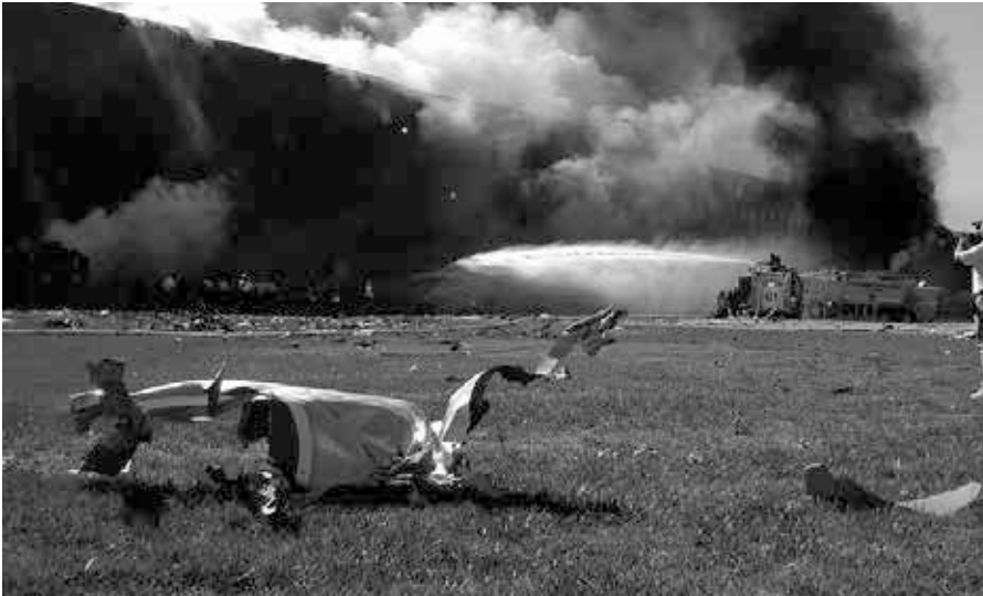
Wrackteil von Flug 77 beim Pentagon.

und schließlich zu einem Strömungsabriss führt [15]. Auch hier ist die Annahme plausibler, dass diese 2. Explosion (offiziell um ca. 9:38), welche anfangs nur ein Loch mit rund 5 Metern Durchmesser in die Aussenfassade riss, Schäden im Erdgeschoss verursachte und von Videokameras dokumentiert wurde (die meisten Aufnahmen wurden natürlich nicht freigegeben), durch eine Bombe im betroffenen Gebäudeteil, der gerade kürzlich renoviert und verstärkt worden war, erzeugt wurde. Die Aufnahmen zeigen eine sehr helle, weiss-gelbe Farbe im Zentrum der