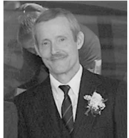
Bruce Edwards Ivins war ein US-amerikanischer Mikrobiologe, Immunologe und Forscher für B-Waffen. Er ist laut FBI und örtlicher Staatsanwaltschaft Hauptverdächtiger der Anthrax-Anschläge 2001.