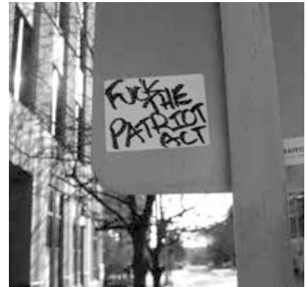
Der USA PATRIOT Act ist ein US-amerikanisches Bundesgesetz, das am 26. Oktober 2001 vom Kongress im Zuge des Krieges gegen den Terrorismus verabschiedet wurde..

So wurden umfangreiche Untersuchungsakten der Börsenaufsicht und anderer Behörden gegen verschiedene Firmen wie „Enron“, „WorldCom“ und „California electricity“ vernichtet, welche dringend in Verdacht standen Börsenmanipulationen, Steuerhinterziehungen und Betrug in Milliardenhöhe (insgesamt rund 70 Milliarden Dollar) begangen zu haben, nicht nur im Gebäude WTC 7 sondern auch im WTC 6 (dem sog. „CustomsHouse“). Auch dieses Gebäude wurde stark zerstört und wies in seiner Mitte ein großes, klaffendes Loch bis in die Untergeschosse auf (siehe entsprechende Luftaufnahmen). Im WTC 6, von dem interessanterweise kaum gesprochen wird,