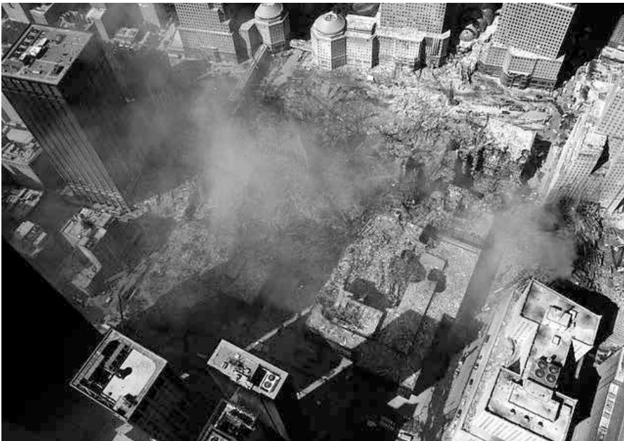
WTC Ground Zero Aerial.

„Free energy weapons“ (Dr. Judy Wood) sind natürlich spekulativ, auch wenn viele eigenartige Erscheinungen beobachtet wurden, wie etwa die seltsam verbrannten und korrodierten Autos (rund 1.400 an der Zahl) in der Umgebung des WTC während Tausende Seiten Papier in der Gegend herumflogen ohne Feuer zu fangen! Die eingesetzten Mittel müssen gezielt den Stahl und Beton angegriffen haben, denn die Gebäude wurden zu weit über 90% pulverisiert (der englische Ausdruck „dustification“ trifft es weit besser), was natürlich nichts mit einem „Zusammen-