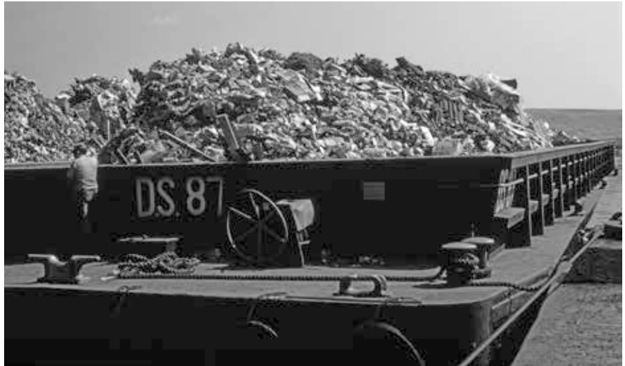
Fresh Kills Landfill ist eine stillgelegte Mülldeponie im New Yorker Stadtbezirk Staten Island in den Vereinigten Staaten. Im März 2001 wurde die Deponie stillgelegt. Nach dem Terroranschlag am 11. September 2001 auf das World Trade Center wurde die Deponie wieder geöffnet, um Trümmer aufzunehmen; seitdem wird das zwölf Quadratkilometer große Areal zu einer Parkanlage umgewandelt..

Zu den Vorgängen beim Pentagon und zum angeblichen Absturz eines entführten Flugzeuges nach einem heroischen Kampf mit den Entführern in Shanksville, wo überhaupt keine nennenswerten Wrackteile und keine Leichen gefunden wurden welche auf ein großes Verkehrsflugzeug schließen lassen, gab es schon früh Zweifel an den offiziellen Darstellungen [14]. Bis heute haben die Spekulationen dazu nicht mehr nachgelassen. Mit größter Wahrscheinlichkeit explodierte um ca. 9:32 auf dem Rasen vor dem Pentagon eine ferngesteuerte Drohne mit den Farben von American Airlines welche von Zeugen als klei-