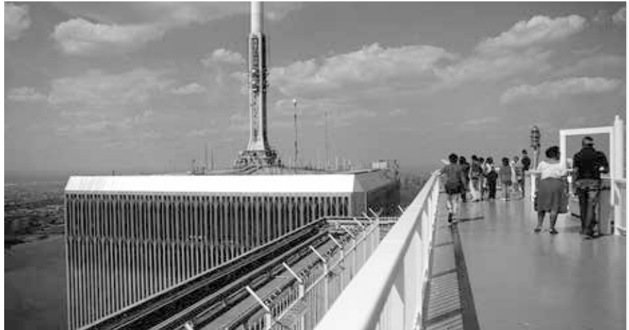
Aussichtsplattform des World Trade Centers (Südturm) mit einem Selbstmordzaun.

Diese Theorie widerspricht nach meiner Auffassung bewährten fundamentalen physikalischen Prinzipien wie dem 3. Newtonschen Bewegungsgesetz („actio et reactio“) wonach ein schwächerer oberer Block nicht einen progressiv stärker werdenden und viel größeren unteren Teil komplett zerstören kann ohne sich nicht vorher selbst aufgelöst zu haben so dass der „Zusammenbruch“ zum Stillstand gekommen wäre (entsprechende Modellversuche wurden in den USA mit verschiedensten Materialien wie Holz, Metall, Beton oder Schnee gemacht). Zudem hat auch das NIST (National Institut for Standards and Technology) in seinen 2005 veröffentlichten Studien (welche nur den Einsturzbeginn erklären sollen) zugegeben, dass die Temperaturen des Stahls in den betroffenen Etagen nie 600° Celsius überschritten (effektiv nachgewiesen wurden gar nur 250° Celsius) da Stahl auch eine sehr hohe Wärmespeicherkapazität hat und deshalb nicht sofort die maximalen Temperaturen der Feuer aufweist. Die Brandherde gingen auch relativ rasch aus oder wanderten weiter nach innen (wo sie wahrscheinlich noch schlechter brannten), wie man an der „Einschlagsstelle“ des Nordturmes sehen kann wo es Aufnahmen einer Frau gibt (es handelte sich vermutlich um die Angestellte Edna Cintron), die sich im 94. Stockwerk links unterhalb der großen Öffnung verzwei-