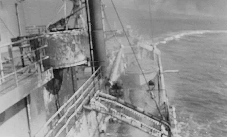
Das elektronische Aufklärungsschiff USS Liberty (AGTR-5) der US Navy dreht sich, während es am 8. Juni 1967 von israelischen Motortorpedobooten angegriffen wird, vor der Sinai-Halbinsel. Quelle: https://en.m.wikipedia.org/wiki/File:USS_Liberty_(AGTR-5)_turns_while_under_attack_by_Israeli_motor_torpedo_boats,_8_June_1967_(USN_1123754).jpg , Foto: Wikipedia / U.S. Navy photo USN 1123754, Lizenz: Public Domain

Ende 2002 aus einem Bericht der "Joint investigation" herausgestrichen bzw. zensuriert wurden in denen es um die Finanzierung der Anschläge durch saudische Regierungs- und Geheimdienstmitglieder geht, und spricht diesbezüglich von einer "aggressive deception" seitens der Regierung welche die Glaubwürdigkeit der amerikanischen Republik untergrabe!