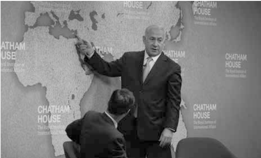
Benjamin Netanyahu, Premierminister, Staat Israel.