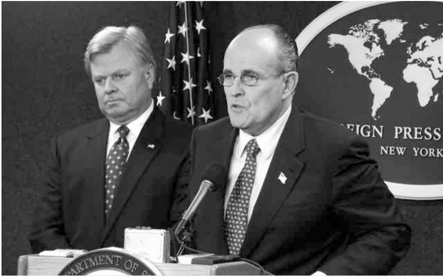
Rudolph Giuliani, ehemaliger Bürgermeister von New York City, und Thomas von Essen, ehemaliger Feuerwehrkommissar von New York City im New Yorker Foreign Press Center Briefing über „New York City nach dem 11. September 2001“.

welcher die Twintower nur knappe 6 Wochen vor dem Anschlag für nur 14 Millionen Dollar und rund 100 Millionen Dollar Kredit auf 99 Jahre hinaus leaste (die mittlerweile unrentablen und asbestbelasteten Gebäude gehörten vorher der Hafenbehörde und wurden unter Lewis Eisenberg privatisiert) und der sofort die Versicherungssumme speziell gegen Terroranschläge von rund 1,2 auf 3,55 Milliarden Dollar erhöhte, später 4,55 Milliarden Dollar Entschädigung abkassierte, nachdem er jahrelang gegen 22 Versicherungen (darunter „Swiss Re“) prozessieren musste, die sich anfangs aus verständlichen Gründen allesamt weigerten auch nur einen Cent zu bezahlen! Zudem erwirkte er mit dem Vertrag gleichzeitig das Recht, im Falle einer Zerstörung oder eines Abbruchs des WTC dort etwas Neues bauen zu dürfen. Laut seinen eigenen Aussagen an einer Konferenz 2014 in Eilat, Israel [13] traf er sich schon im Frühjahr 2000 (!) zum ersten Mal mit seinen Architekten um einen Neubau zu planen und rund 2 Jahre später konnte mit dem Bau des „FreedomTower“ und der Gedenkstätte begonnen werden, nachdem die letzten Trümmer des alten WTC beseitigt und der teilweise aufgeschmolzene Untergrund (!) ausbetoniert worden waren. Selbstverständlich hielt er sich an 9/11 nicht wie üblich hoch oben im Restaurant des Nordturmes