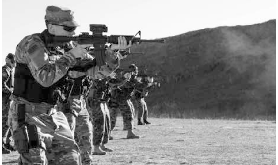
Die US-amerikanische und kanadische Militärpolizei führt in Rumänien ein Waffentraining durch. Quelle: https://www.usar.army.mil/News/Images.aspx?igphoto=2002226490