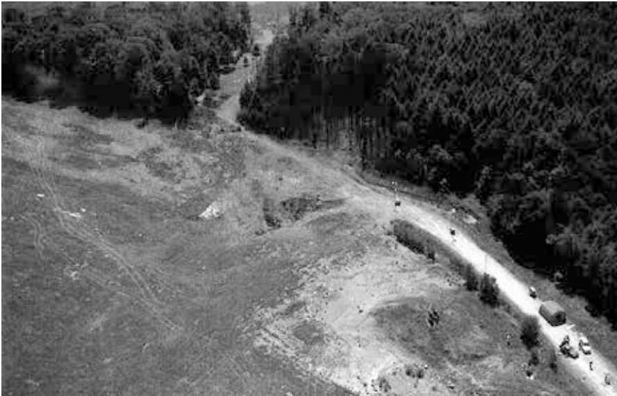
Der United-Airlines-Flug 93 wurde am 11. September 2001 als eine der vier Maschinen, die für die Terroranschläge in New York und Washington, D.C. benutzt wurden, entführt und stürzte in der Nähe von Shanksville, Pennsylvania ab. Quelle: https://en.wikipedia.org/wiki/United_Airlines_Flight_93 , Foto: Wikimedia / U.S. Government, Lizens: Public Domain

gestochen scharfes Bild des im 78. Stockwerk explodierenden Südturmes haben, da er sich zu dem Zeitpunkt genau unterhalb der Fassade befand wo angeblich das 2. Flugzeug (UA 175) einschlug, waren hier die berühmten Ausnahmen („it just blew up“)! Der amerikanische Musiker und Videoexperte Ace Baker alias Alexander Collins hat in seinem 2012 veröffentlichten 8-teiligen Werk „9/11 - The Great American Psyopera“ [7] in Teil 6 und 7 detailliert erklärt, wie die Aufnahmen von den Flugzeugen, die wir damals alle im Fernsehen sahen, mit „Videocompositing“ künstlich hergestellt und damit Millionen von Menschen weltweit getäuscht wurden und wie uns die Massenmedien die offizielle Lügengeschichte (damals und heute) verkauften. Dabei wurden auch gravierende technische Fehler gemacht, wie in den nur einmal von Fox-TV ausgestrahlten Live-Aufnahmen wo das von rechts in den Südturm fliegende „Terroristenflugzeug“ mit völlig intakter Nase („Pinocchio's nose“) auf der anderen Seite des Gebäudes wieder herauschaute, da der über dem „Hackensack“-River in New Jersey befindliche Helikopter mit dem Kameraoperator Kain Simon sich seitlich wegbewegte (wegen des Drehmomentes des Rotors) so dass die „Maske“ (ähnlich wie im „Photoshop“) sich aus dem Turm herausverschob und das