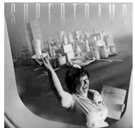
Vintage Vinyl LP Record Album - Breakfast In America Vinyl LP By Supertramp, Catalog Number SP-3708, Rock, A&M Records, 197.

Stahl mit einem Schmelzpunkt von rund 1.535° Celsius und einer guten Wärmeleitfähigkeit (die Wärme wird also bei lokalen Bränden verteilt) kann auf diese Weise niemals geschmolzen oder in so kurzer Zeit derart geschwächt werden dass ein kompletter, gravitativ bedingter Zusammenbruch erfolgt wie dies in verschiedenen offiziellen Darstellungen immer wieder behauptet wurde (mit der „Pancaketheorie“ wonach eine einstürzende Etage die jeweils darunter liegende kaskadenartig mitreißt bzw. später mit der „Pile-drivertheory“ bei der ein ganzer oberer Block von 12–15 Etagen wie im Falle des Nordturmes bzw. von rund