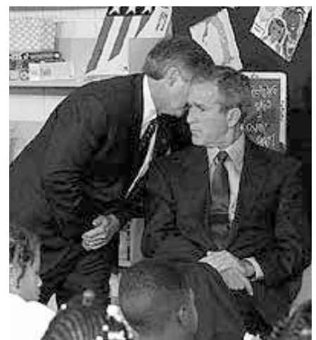
Präsident Bush erfährt von den Anschlägen vom 11. September.

Telefongesprächen mit Angehörigen um plumpe Inszenierungen gehandelt haben muss, wird durch den auf dem Telefonbeantworter ihres Mannes am Ende der wie auswendig gelernten Durchsage kaum hörbaren Zusatz „It’s a frame“ der Flugbegleiterin CeeCee Lyles klar. Es scheint, als seien diese Passagiere von jemandem zu ihren Aussagen genötigt worden, welche natürlich die offizielle Version der von Terroristen mit Teppichmessern entführten Verkehrsflugzeuge stützen sollten. Dabei sind gerade die der Weltöffentlichkeit