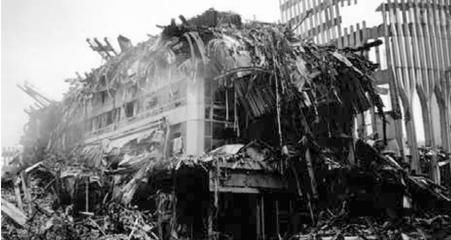
World Trade Centers 3 mit Resten von WTC1 (linker Hintergrund) und WTC2 (rechter Vordergrund) sichtbar.