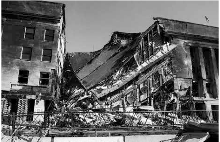
Arlington, Virginia (12. September 2001) Ein Teil des Pentagons liegt nach dem tödlichen Terroranschlag vom 11. September, bei dem ein entführtes Verkehrsflugzeug gegen das Pentagon stürzte, in Trümmern..

während die beiden Flugzeuge von United Airlines noch bis Herbst 2005 im Dienst waren! Über den Verbleib der Pas-