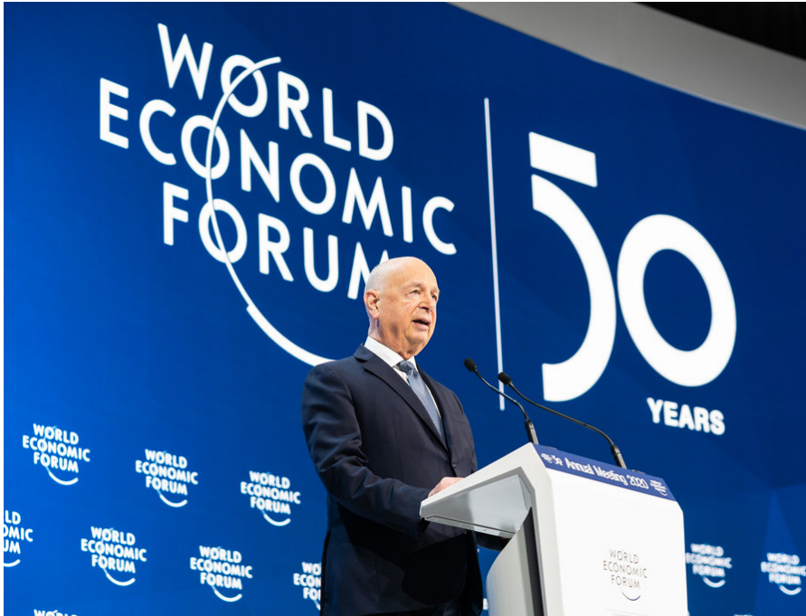
Klaus Schwab, Wirtschaftswissenschaftler aus Ravensburg und Gründer des WEF, spricht auf dem Weltwirtschafts-Forum 2020. Er schrieb das Buch „Die vierte industrielle Revolution“. „Vierte industrielle Revolution“ und „Stakeholder Kapitalismus“ werden beim nächsten Treffen des WEF 2021, unter dem Titel „The Great Reset“, diskutiert.

bus zugeschaltet. Bereits im April trafen sich im Internet nachwachsende Talente der schönen neuen Technowelt unter dem Motto „Reset Everything“ [5]. Es sind die euphorisierten Jünger der neuen künstlichen Plastikwelt. Es ging um 5G, Transhumanismus, Künstliche Intelligenz, Kryptowährung, Impfungen neuen Typs oder um Lebensverlängerung.