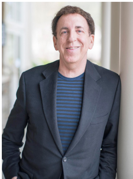
Dr. Dean Ornish entwickelte Therapien zur Linderung der koronaren Herzkrankheit, wodurch Herzoperationen vermeidbar werden.