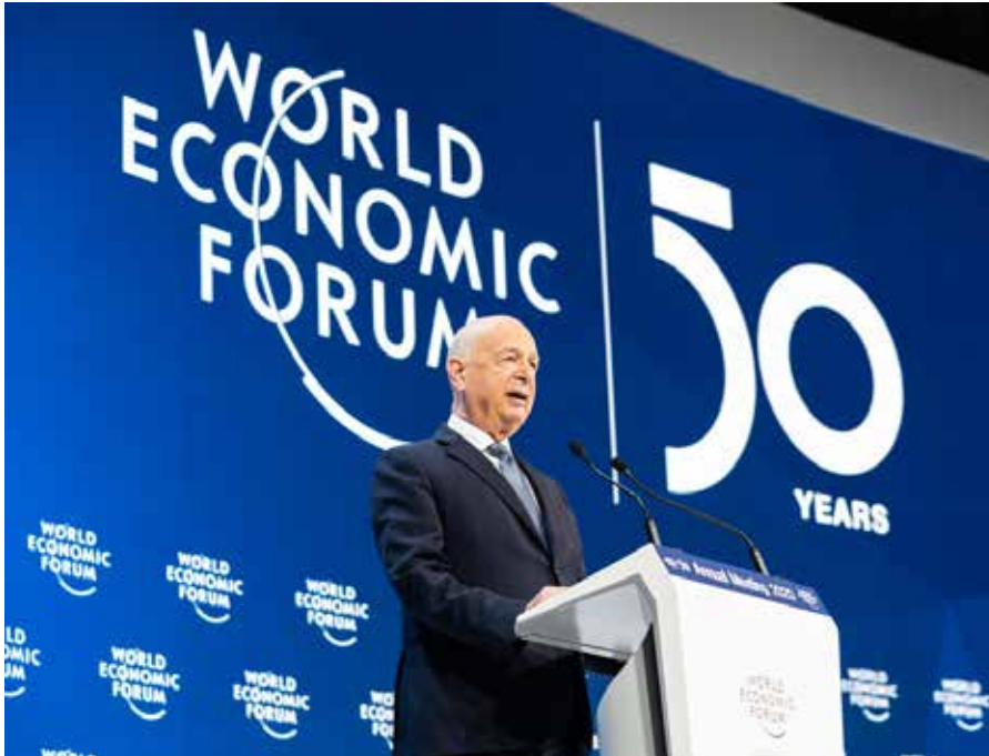
Klaus Schwab, Wirtschaftswissenschaftler aus Ravensburg und Gründer des WEF, spricht auf dem Weltwirtschafts-Forum 2020. Er schrieb das Buch „Die vierte industrielle Revolution“. „Vierte industrielle Revolution“ und „Stakeholder Kapitalismus“ werden beim nächsten Treffen des WEF 2021, unter dem Titel „The Great Reset“, diskutiert.

bus zugeschaltet. Bereits im April trafen sich im Internet nachwachsende Talente der schönen neuen Technowelt unter dem Motto „Reset Everything“ [5]. Es sind die euphorisierten Jünger der neuen künstlichen Plastikwelt. Es ging um 5G, Transhumanismus, Künstliche Intelligenz, Kryptowährung, Impfungen neuen Typs oder um Lebensverlängerung.