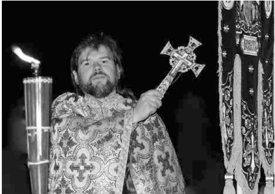
Grosse Wasserweihe, orthodoxer Priester mit goldenem Kreuz.

Das ist auch der Grund, warum zum Beispiel die Zeugen Jehovas in Russland verboten wurden: In ihren Schriften äußern sie sich abfällig über andere Glaubensrichtungen und Religionen. Das ist in Russland verboten. Man darf glauben, was man will, aber man darf Anhänger anderer Glaubensrichtungen oder Religionen nicht herabwürdigen. Da der Leser von Herrn Franke das nicht weiß, klingt das Folgende für den unwissenden Leser ganz schlimm: