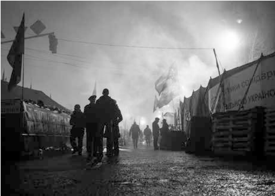
Der Majdan Nesaleschnosti (deutsch „Platz der Unabhängigkeit“ bzw. „Unabhängigkeitsplatz“) ist der zentrale Platz der ukrainischen Hauptstadt Kiew. Er wird meist kurz Majdan genannt. Der Majdan wurde im Jahr 2004 durch die Orange Revolution weltbekannt.

Man sieht schon daran, dass die Kritik der UNO an den Zuständen in der Ukraine ungleich heftiger und vielfältiger ist, als an den Zuständen auf der Krim. Noch wichtiger: Die Situation der Krimtataren wird gar nicht erwähnt. Und das hat einen Grund: Als erste Amtshandlung hat Russland, nachdem die Krim ein Teil des Landes geworden war, die Rechte der Krimtataren wieder hergestellt, die sie vorher unter ukrainischer Herrschaft nicht hatten. Ihre Sprache ist nun wieder offizielle Amtssprache, in den Schulen wird in ihrer Sprache unterrichtet [8] und an der Universität wurde die krimtatarische Fakultät wieder eröffnet. Nur das erfährt man bei Herrn Franke alles nicht. Bei ihm steht stattdessen zu lesen: