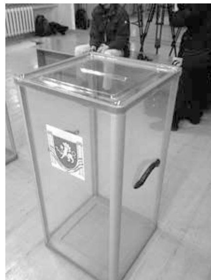
Das Referendum über den Status der Krim fand am 16. März 2014 statt.

Entgegen den Meldungen der westlichen Presse war das nicht das Eingeständnis von Wahlfälschung, sondern es waren die subjektiven Einschätzungen von einigen „befragten Spezialisten und Bürgern“ auf der Krim, die einigen Mitgliedern des Rates bei Gesprächen auf der