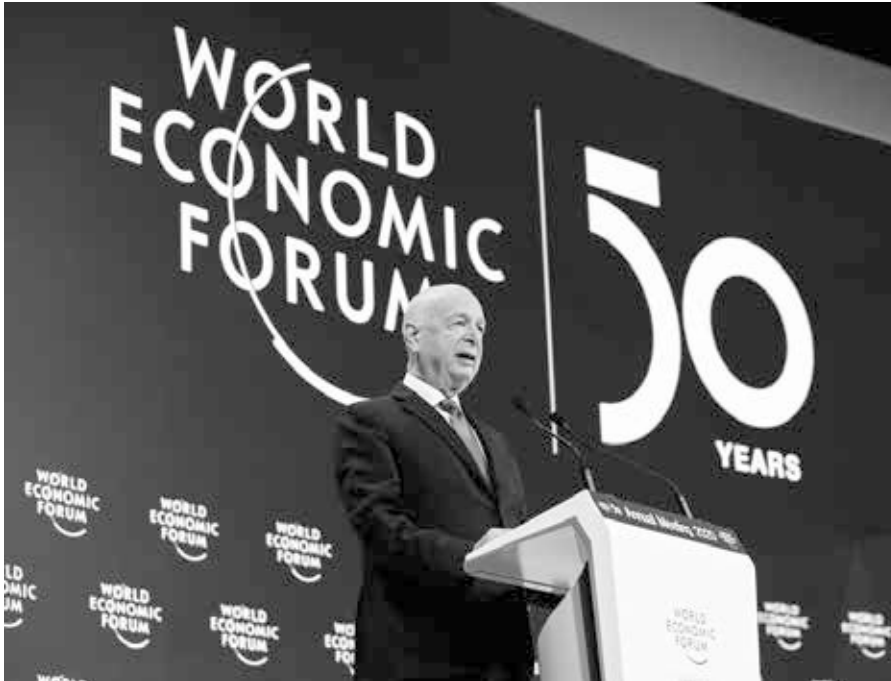
Klaus Schwab, Wirtschaftswissenschaftler aus Ravensburg und Gründer des WEF, spricht auf dem Weltwirtschafts-Forum 2020. Er schrieb das Buch „Die vierte industrielle Revolution“. „Vierte industrielle Revolution“ und „Stakeholder Kapitalismus“ werden beim nächsten Treffen des WEF 2021, unter dem Titel „The Great Reset“, diskutiert.

bus zugeschaltet. Bereits im April trafen sich im Internet nachwachsende Talente der schönen neuen Technowelt unter dem Motto „Reset Everything“ [5]. Es sind die euphorisierten Jünger der neuen künstlichen Plastikwelt. Es ging um 5G, Transhumanismus, Künstliche Intelligenz, Kryptowährung, Impfungen neuen Typs oder um Lebensverlängerung.