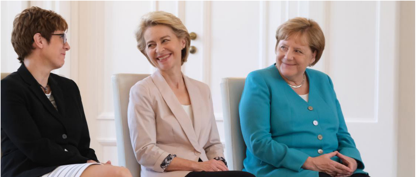
Annegret Kramp-Karrenbauer, Ursula von der Leyen und Angela Merkel (v.l.) im Schloss Bellevue. Nun dringen sie auf die Erhöhung des deutschen Militäretats.

Politikerinnen wie Annegret Kramp-Karrenbauer und Ursula von der Leyen im Einvernehmen mit Kanzlerin Angela Merkel auf die Erhöhung des deutschen Militäretats. [9]