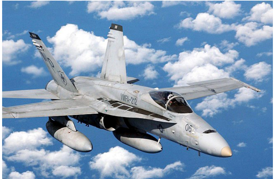
Die F/A-18 Hornet ist ein zweistrahliges Mehrzweckkampfflugzeug des US-amerikanischen Herstellers McDonnell Douglas (seit 1997 Teil von Boeing).bn

Ein friedenspolitischer Lichtblick ist die kürzlich von SPD-Fraktionschef Rolf Mützenich erhobene Forderung nach Abzug aller Atomwaffen aus Deutschland. Mützenich, der von dem SPD-Vorsitzen-