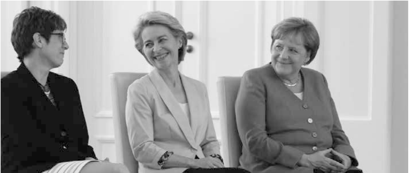
Annegret Kramp-Karrenbauer, Ursula von der Leyen und Angela Merkel (v.l.) im Schloss Bellevue. Nun dringen sie auf die Erhöhung des deutschen Militäretats.

Politikerinnen wie Annegret Kramp-Karrenbauer und Ursula von der Leyen im Einvernehmen mit Kanzlerin Angela Merkel auf die Erhöhung des deutschen Militäretats. [9]