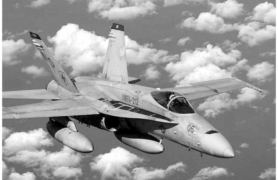
Die F/A-18 Hornet ist ein zweistrahliges Mehrzweckkampfflugzeug des US-amerikanischen Herstellers McDonnell Douglas (seit 1997 Teil von Boeing).bn

Ein friedenspolitischer Lichtblick ist die kürzlich von SPD-Fraktionschef Rolf Mützenich erhobene Forderung nach Abzug aller Atomwaffen aus Deutschland. Mützenich, der von dem SPD-Vorsitzen-