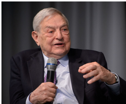
George Soros ist ein US-amerikanischer Investor ungarischer Herkunft und Geldgeber vieler Fonds, unter anderem des Quantum Funds.

Das sind heftige Vorwürfe, die ich – so weit es mir möglich war – überprüft habe. In der Studie werden all die Richter namentlich genannt. Da es Richter aus allen europäischen Ländern sind, habe ich nicht in allen Fällen ihre Biografien in einer für mich verständlichen Sprache gefunden. Bei den Richtern, zu denen ich Biografien gefunden habe, die ich verstehen konnte, haben sich die erhobenen Vorwürfe und die Verbindungen der Richter zu den Soros-Stiftungen [2] bestätigt. Ich habe in der Studie keinen Fehler gefunden, übernehme aber keine Gewähr dafür, dass es keine gibt.