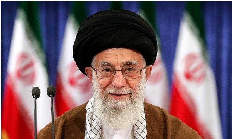
Ali Chamenei (17. Juli 1939 in Maschhad) ist als „Oberster Führer“ seit 1989 das politische und religiöse Oberhaupt des mehrheitlich schiitischen Iran. (Quelle: https://commons.wikimedia.org/wiki/File:Ayatollah_Ali_Khamenei_casting_his_vote_for_2017_election_3.jpg , Foto: Wikimedia / Hossein Zohrevand, Lizenz: CC BY 4.0)

Zusätzlich kann man beobachten, dass das Parlament sich immer mehr Rechte und Einfluss erkämpft. Was wiederum durch die Ablehnung von Kandidaten zur Wahl gedämpft wurde. Wogegen andererseits die Parteien ein System von Stellvertreterkandidaturen entwickelt haben. Man sieht, im Iran gibt es viel Bewegung in der Verteilung der politischen Macht und der Entwicklung der politischen Kultur.