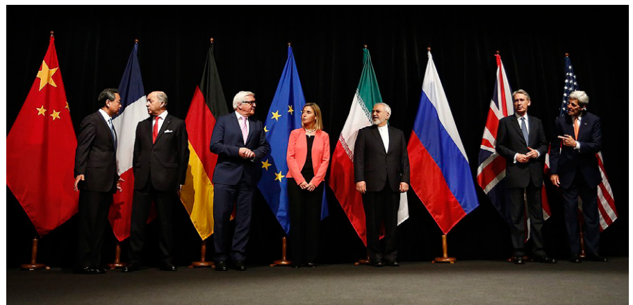
Abschluss Iran Verhandlungen. UNO. Wien, 14.07.2015.

Die Antworten: „Ich würde eine solche Vereinbarung stark unterstützen = 12,6%“, „Ich würde eine solche Vereinbarung etwas unterstützen = 31,1%“, „ich wäre etwas dagegen = 22,0%“, „Ich wäre stark dagegen = 32,1%“.