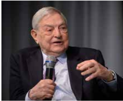
George Soros ist ein US-amerikanischer Investor ungarischer Herkunft und Geldgeber vieler Fonds, unter anderem des Quantum Funds.

Das sind heftige Vorwürfe, die ich – so weit es mir möglich war – überprüft habe. In der Studie werden all die Richter namentlich genannt. Da es Richter aus allen europäischen Ländern sind, habe ich nicht in allen Fällen ihre Biografien in einer für mich verständlichen Sprache gefunden. Bei den Richtern, zu denen ich Biografien gefunden habe, die ich verstehen konnte, haben sich die erhobenen Vorwürfe und die Verbindungen der Richter zu den Soros-Stiftungen [2] bestätigt. Ich habe in der Studie keinen Fehler gefunden, übernehme aber keine Gewähr dafür, dass es keine gibt.