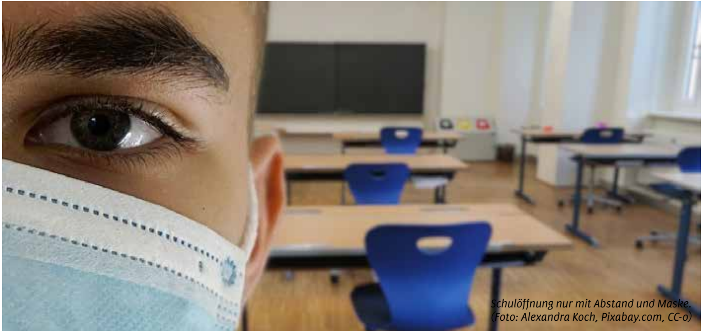
Schulöffnung nur mit Abstand und Maske.