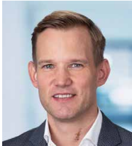
Prof. Dr. Hendrik Streeck, Studienleiter der sogenannten „Heinsberg Studie“. Bei der Studie ging das Forscherteam von Tür zu Tür und sammelte Rachenabstriche der Bewohner und Haustiere.