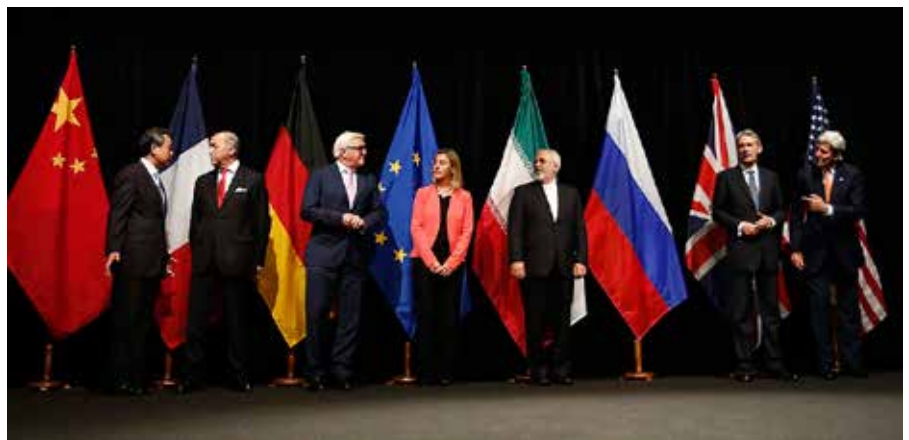
Abschluss Iran Verhandlungen. UNO. Wien, 14.07.2015.

Die Antworten: „Ich würde eine solche Vereinbarung stark unterstützen = 12,6%“, „Ich würde eine solche Vereinbarung etwas unterstützen = 31,1%“, „ich wäre etwas dagegen = 22,0%“, „Ich wäre stark dagegen = 32,1%“.