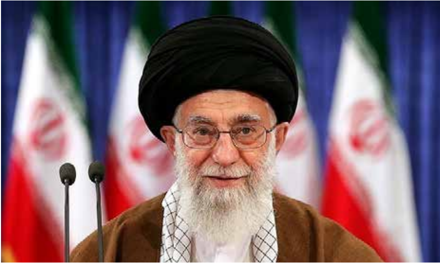
Ali Chamenei (17. Juli 1939 in Maschhad) ist als „Oberster Führer“ seit 1989 das politische und religiöse Oberhaupt des mehrheitlich schiitischen Iran.

Zusätzlich kann man beobachten, dass das Parlament sich immer mehr Rechte und Einfluss erkämpft. Was wiederum durch die Ablehnung von Kandidaten zur Wahl gedämpft wurde. Wogegen andererseits die Parteien ein System von Stellvertreterkandidaturen entwickelt haben. Man sieht, im Iran gibt es viel Bewegung in der Verteilung der politischen Macht und der Entwicklung der politischen Kultur.