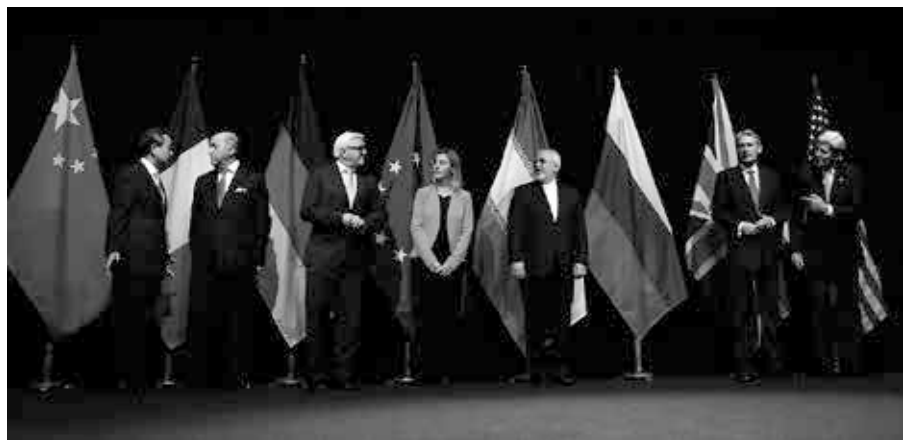
Abschluss Iran Verhandlungen. UNO. Wien, 14.07.2015.

Die Antworten: „Ich würde eine solche Vereinbarung stark unterstützen = 12,6%“, „Ich würde eine solche Vereinbarung etwas unterstützen = 31,1%“, „ich wäre etwas dagegen = 22,0%“, „Ich wäre stark dagegen = 32,1%“.