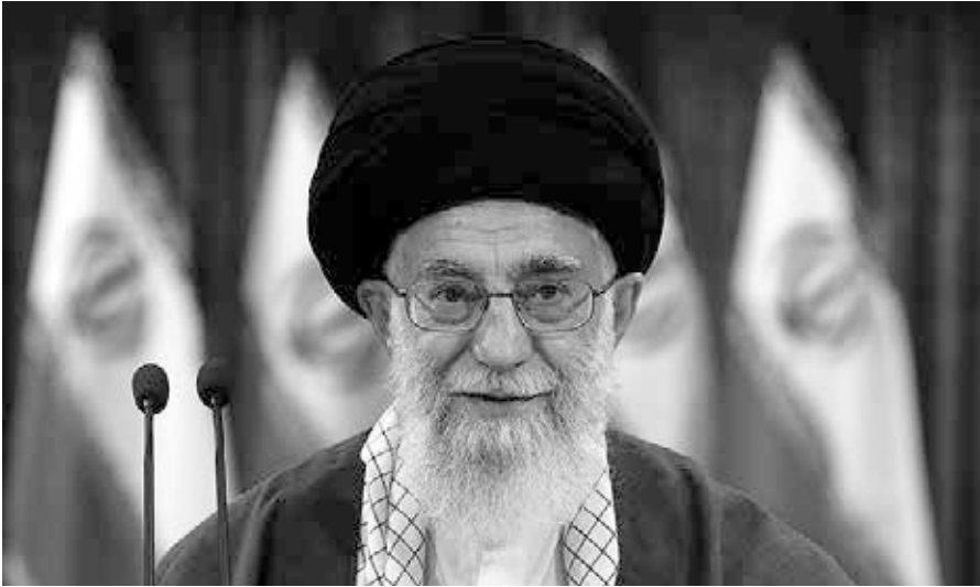
Ali Chamenei (17. Juli 1939 in Maschhad) ist als „Oberster Führer“ seit 1989 das politische und religiöse Oberhaupt des mehrheitlich schiitischen Iran.

Zusätzlich kann man beobachten, dass das Parlament sich immer mehr Rechte und Einfluss erkämpft. Was wiederum durch die Ablehnung von Kandidaten zur Wahl gedämpft wurde. Wogegen andererseits die Parteien ein System von Stellvertreterkandidaturen entwickelt haben. Man sieht, im Iran gibt es viel Bewegung in der Verteilung der politischen Macht und der Entwicklung der politischen Kultur.