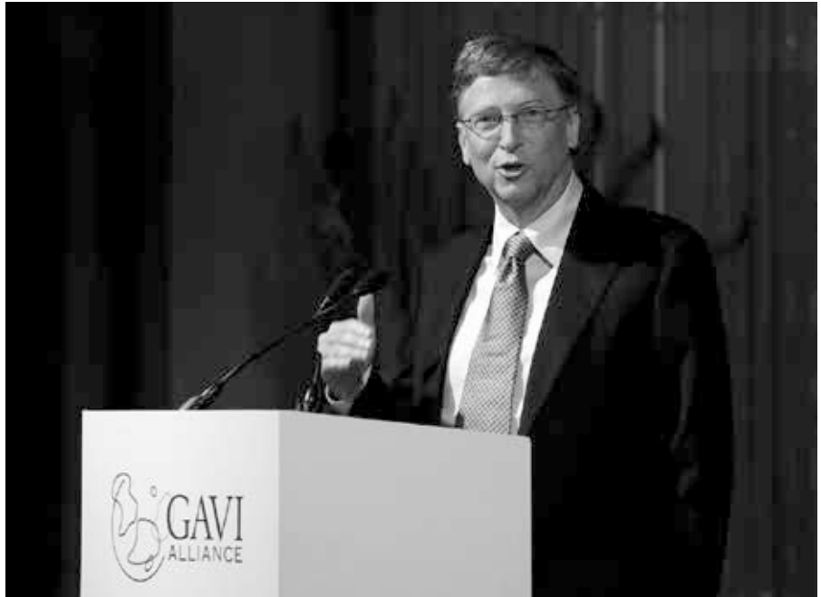
Bill_Gates,_speaking_at_the_UK-hosted_GAVI_immunisation_Alliance_pledging_event.jpg Bildtext: Der Gründer von Microsoft Bill Gates sprach am 13. Juni 2011 auf der GAVI Alliance-Immunisierungsveranstaltung in Großbritannien. Quelle: https://ru.wikipedia.org/wiki/Файл:Bill_Gates,_speaking_at_the_UK-hosted_GAVI_immunisation_Alliance_pledging_event.jpg

Basis soll hier das vom Bundeswirtschaftsministerium geförderte Lissi-Forschungsprojekt [9] sein, bei dem die Bundesdruckerei federführend ist. Lissi steht