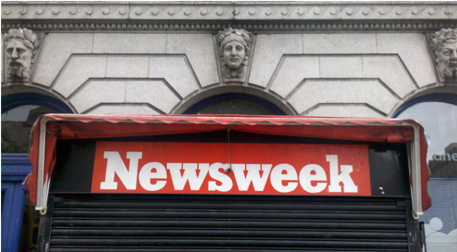
Newsweek ist ein wöchentlich erscheinendes US-amerikanisches Nachrichtenmagazin mit Hauptsitz in New York.

Medien seit den 1970er Jahren [15] und insbesondere in den letzten Jahren [16] gesunken ist.