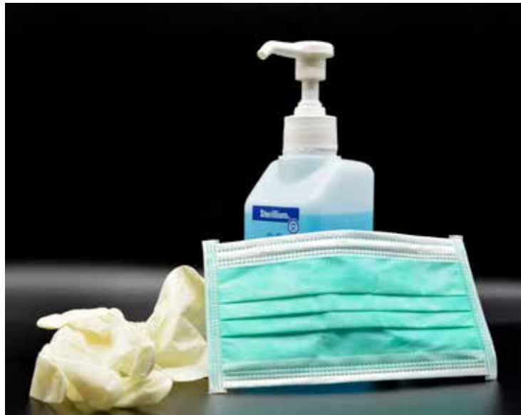
Desinfektionsmittel mit 62%-igem bis 71%-igem Ethanol tötet Corona-Viren innerhalb einer Minute.

Die Serie von peinlichen Pannen lässt sich erweitern: Hände-Desinfektion! Empfohlen, da wirksam und schon zu Zeiten der Spanischen Grippe empfohlen. Haben wir von unseren Entscheidungsträgern je gehört, welche Desinfektionsmittel denn wirksam sind und welche nicht? Haben wir nicht, obwohl am 6. Febru-