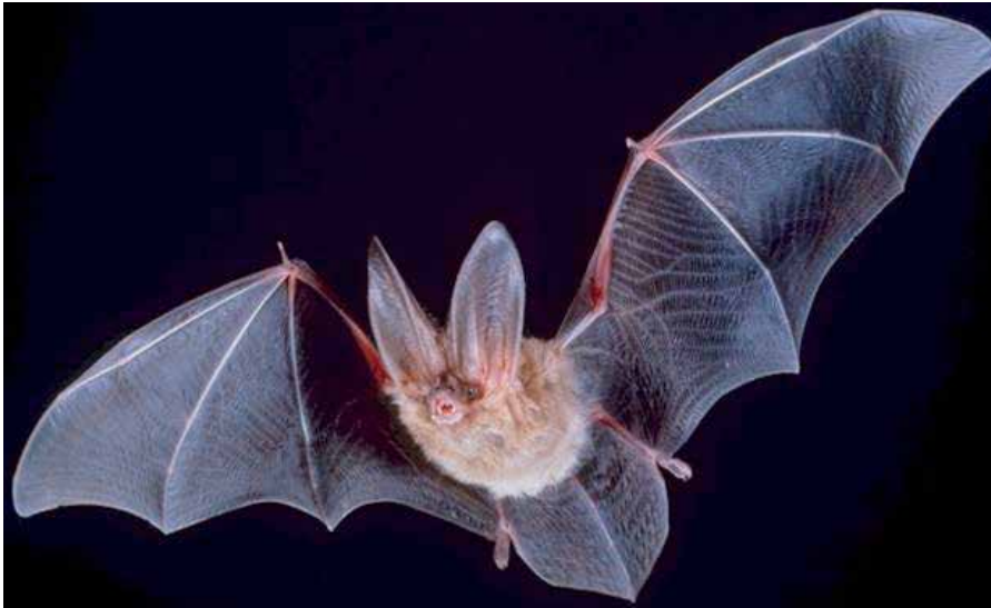
Fledermäuse (bats) und Flughunde machen 20% der Säugetier-Population aus und beherbergen zahlreiche gefährliche Viren, die auf den Menschen übersprungen. Hier Townsend Langohr Fledermaus.