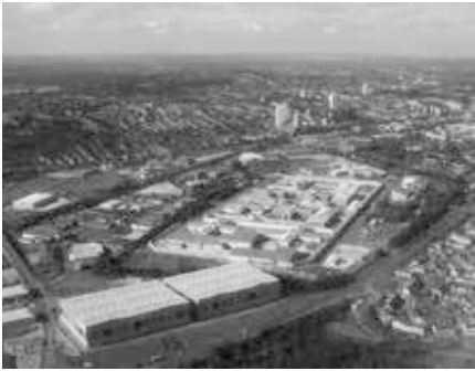
Luftaufnahme vom HM Prison Belmarsh und Woolwich, in dem Julian Assange seit April 2019 in Haft sitzt.