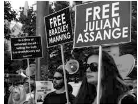
Seit nunmehr 10 Jahren demonstrieren Menschen an vielen Orten auf der Welt für Presse- und Meinungsfreiheit, wie hier in Melbourne am 14.12.2010.