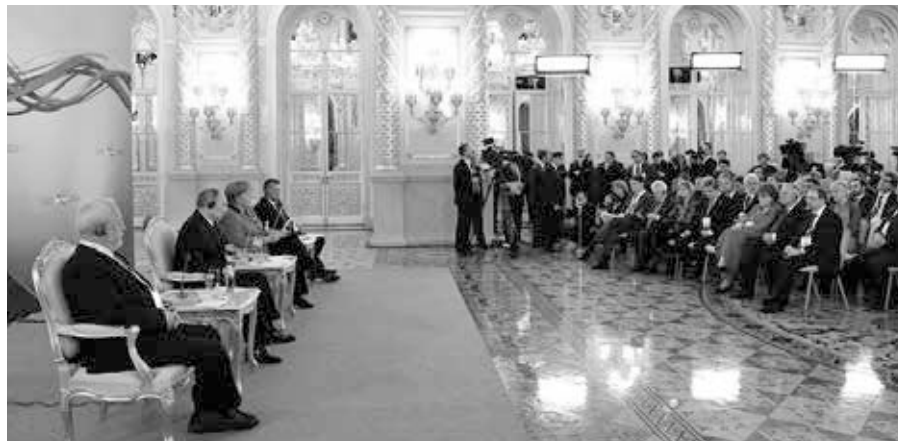
Russisch-Deutsches Treffen während des Petersburger Dialogs im Rahmen eines öffentlichen Forums. Quelle: http://en.kremlin.ru/events/president/news/16848 , Foto: President of Russia, Lizenz: Public Domain

Für die allseits eingeklagte Rekonstruktion des Vertrauens würde dies bedeuten: Vertrauen kann weder befohlen noch als reiner Willensakt im Senkrecht-