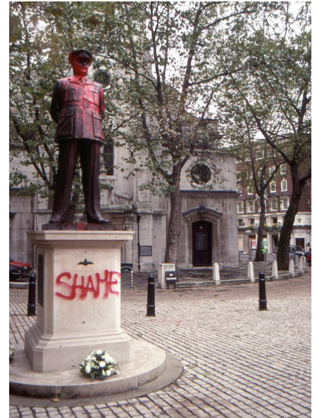
„Bomber“ Harris Denkmal, 1992.

Und so macht sich am Abend des 13. Februar 1945 eine riesige britische Luftflotte mit Jägern und Bombern auf den Weg nach Dresden. Die Briten kommen immer nachts, weil ihre Bomber technologisch weit hinter den US-amerikanischen Bomberflotten zurück geblieben sind und für eine deutsche Flugabwehr (die im Falle Dresdens kaum noch vorhanden ist) ein relativ leichtes Ziel abgeben. Die amerikanischen Flying Fortresses greifen dagegen am hellen Tag aus sicherer Höhe an und treffen dabei noch präziser ihre Ziele als die Briten. Die britischen Bomberverbände benötigen ortskundige Piloten, die ihnen voranfliegen und das Ziel der Bombardierung ausfindig ma-