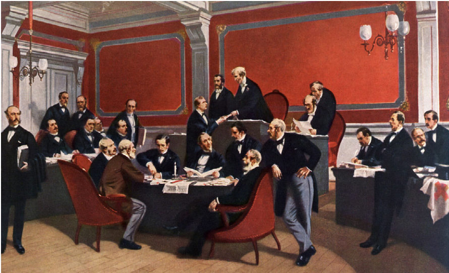
Am 22. August 1864 wird im Stadthaus von Genf die erste Genfer Konvention unterzeichnet, Gemälde von Charles Édouard Armand-Dumaresq.

te sich denn noch groß von Dresden aus an nazideutscher Erhebung entfalten können? Längst machten sich die Nazi- und SS-Bonzen bereit für den Absprung nach Südamerika, und schon im August 1944 hatte die Naziführung die deutsche Wirtschaft angewiesen, schleunigst ihr Geld über die Basler Bank für Internationalen Zahlungsausgleich ins sichere Ausland zu transferieren. Der Krieg war doch aus Sicht der Nazis längst gelaufen [16]. Was sollten wohl die fußkranken und „genesenden“ Volkssturmeinheiten aus Dresden noch wenden? Wie hätte denn diese Laienspielschar den Krieg noch künstlich verlängern können? Sie hätten gegen die gut eingespielten ukrainischen Abteilungen der Roten Armee noch nicht einmal Sparringspartner abgegeben.