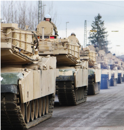
Defender 2020 – größtes NATO-Manöver der letzten Jahrzehnte an den Grenzen Russlands.

von der Georgetown Universität kommt jedenfalls zu einer unmissverständlichen Schlussfolgerung: „Die Bombardierung deutscher Städte während des Zweiten Weltkrieges stellte eindeutig eine Verletzung