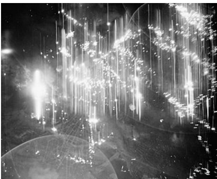
Royal Air Force Bomber Command bei einem Luftangriff auf Hamburg mit Stabbomben, wie sie auch auf Dresden abgeworfen wurden.

Im Zweitschlag wurden die berüchtigten Stabbrandbomben eingesetzt, und zwar allein in Dresden 650.000 Stück, also fast für jeden Dresdner eine Stabbrandbombe. Diese waren teilweise mit Zeitzündern ausgestattet, so dass sie erst explodierten, wenn die Rettungsarbeiten begannen. Zudem wurden jetzt die Feu-