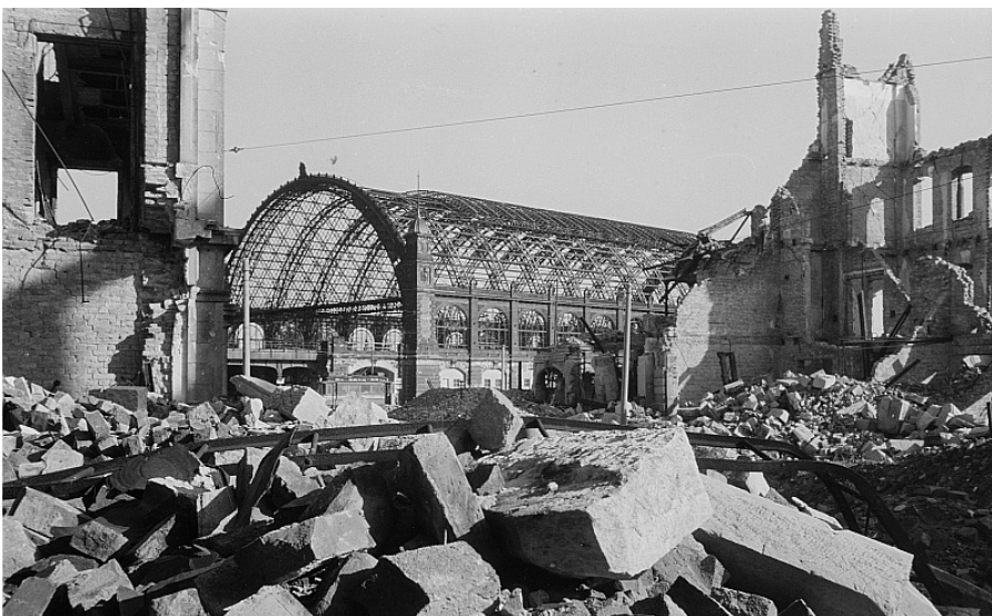
Blick aus den Ruinen an der Jahnstraße zur Ruine der Bahnsteighalle des Bahnhofes Dresden Wettinerstraße. Quelle: https://de.m.wikipedia.org/wiki/Datei:Fotothek_df_ps_0000317_002_Blick_aus_den_Ruinen_an_der_Jahnstra%C3%9F_e_zur_Ruine_der.jpg , Foto: Wikipedia / Richard Peter, Lizenz: CC BY-SA 3.0 DE

Zwischen 22.03 Uhr und 22.28 erfolgt der Abwurf des ersten Bombenteppichs. Alles ist perfekt getaktet: „Massenvernichtung ist Millimeterarbeit, sie käme nicht zustande, würden wahllos Bombentonnen auf einen Ort geladen ... Das Feuer muß schneller sein als die Feuerwehr. Anders wird es kein Vernichtungsangriff, sondern ein Haufen von Brandstellen.“ [6]. Nach der Entwarnung kommen die hustenden Dresdner wieder aus ihren Kellern, in denen sie Schutz gesucht haben. Doch jetzt kommt der finale Stoß, nämlich ein erneuter Angriff ab 1.16 Uhr: „Angriff eins jagt die Leute in den Schutz, Angriff zwei packt die den Schutz erlöst Verlassenden. Die Schutzwirkung von Kellern ist nach zwei Stunden verbraucht.“ [8] Familie Koch aus Rostock hockt im Keller und sieht, wie sich das siedend heiße Phosphor zu ihnen herunterwältzt. Es gelingt ihnen, aus dem Keller und aus der Stadt zu fliehen. Um sie herum vertrock-