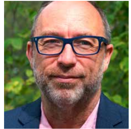
Wikipedia-Mitbegründer Jimmy Wales.