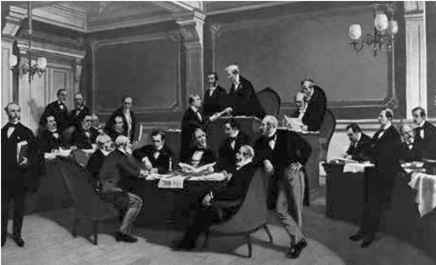
Am 22. August 1864 wird im Stadthaus von Genf die erste Genfer Konvention unterzeichnet, Gemälde von Charles Édouard Armand-Dumaresq.

te sich denn noch groß von Dresden aus an nazideutscher Erhebung entfalten können? Längst machten sich die Nazi- und SS-Bonzen bereit für den Absprung nach Südamerika, und schon im August 1944 hatte die Naziführung die deutsche Wirtschaft angewiesen, schleunigst ihr Geld über die Basler Bank für Internationalen Zahlungsausgleich ins sichere Ausland zu transferieren. Der Krieg war doch aus Sicht der Nazis längst gelaufen [16]. Was sollten wohl die fußkranken und „genesenden“ Volkssturmeinheiten aus Dresden noch wenden? Wie hätte denn diese Laienspielschar den Krieg noch künstlich verlängern können? Sie hätten gegen die gut eingespielten ukrainischen Abteilungen der Roten Armee noch nicht einmal Sparringspartner abgegeben.