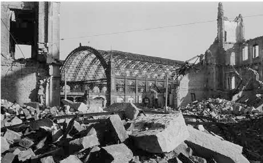
Blick aus den Ruinen an der Jahnstraße zur Ruine der Bahnsteighalle des Bahnhofes Dresden Wettinerstraße. Quelle: https://de.m.wikipedia.org/wiki/Datei:Fotothek_df_ps_0000317_002_Blick_aus_den_Ruinen_an_der_Jahnstra%C3%9F_e_zur_Ruine_der.jpg , Foto: Wikipedia / Richard Peter, Lizenz: CC BY-SA 3.0 DE

Zwischen 22.03 Uhr und 22.28 erfolgt der Abwurf des ersten Bombenteppichs. Alles ist perfekt getaktet: „Massenvernichtung ist Millimeterarbeit, sie käme nicht zustande, würden wahllos Bombentonnen auf einen Ort geladen ... Das Feuer muß schneller sein als die Feuerwehr. Anders wird es kein Vernichtungsangriff, sondern ein Haufen von Brandstellen.“ [6]. Nach der Entwarnung kommen die hustenden Dresdner wieder aus ihren Kellern, in denen sie Schutz gesucht haben. Doch jetzt kommt der finale Stoß, nämlich ein erneuter Angriff ab 1.16 Uhr: „Angriff eins jagt die Leute in den Schutz, Angriff zwei packt die den Schutz erlöst Verlassenden. Die Schutzwirkung von Kellern ist nach zwei Stunden verbraucht.“ [8] Familie Koch aus Rostock hockt im Keller und sieht, wie sich das siedend heiße Phosphor zu ihnen herunterwältzt. Es gelingt ihnen, aus dem Keller und aus der Stadt zu fliehen. Um sie herum vertrock-