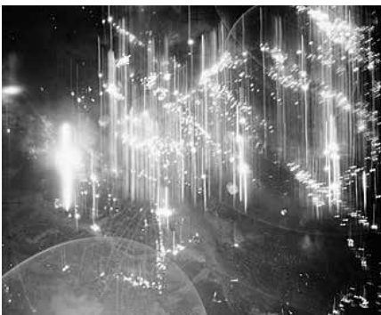
Royal Air Force Bomber Command bei einem Luftangriff auf Hamburg mit Stabbomben, wie sie auch auf Dresden abgeworfen wurden.

Im Zweitschlag wurden die berüchtigten Stabbrandbomben eingesetzt, und zwar allein in Dresden 650.000 Stück, also fast für jeden Dresdner eine Stabbrandbombe. Diese waren teilweise mit Zeitzündern ausgestattet, so dass sie erst explodierten, wenn die Rettungsarbeiten begannen. Zudem wurden jetzt die Feu-