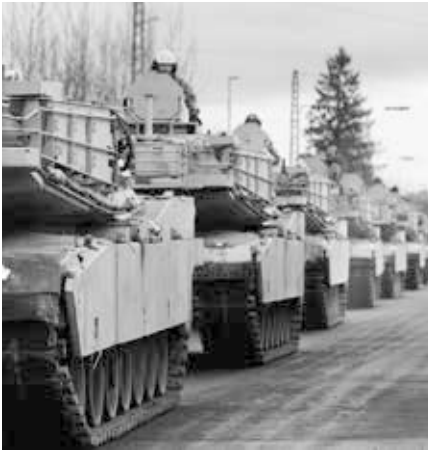
Defender 2020 – größtes NATO-Manöver der letzten Jahrzehnte an den Grenzen Russlands.

von der Georgetown Universität kommt jedenfalls zu einer unmissverständlichen Schlussfolgerung: „Die Bombardierung deutscher Städte während des Zweiten Weltkrieges stellte eindeutig eine Verletzung