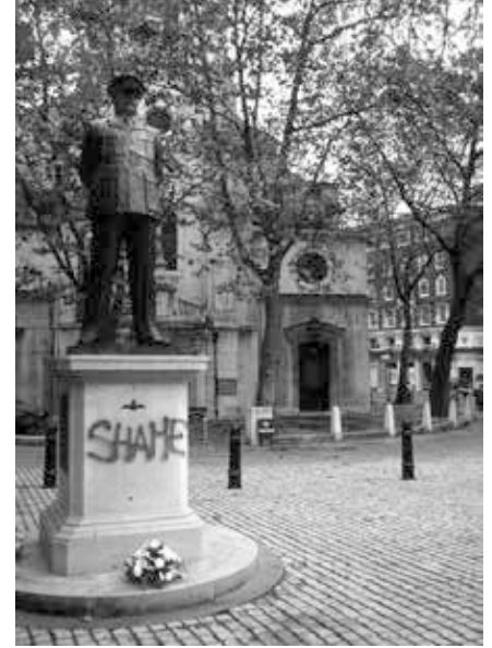
„Bomber“ Harris Denkmal, 1992.

Und so macht sich am Abend des 13. Februar 1945 eine riesige britische Luftflotte mit Jägern und Bombern auf den Weg nach Dresden. Die Briten kommen immer nachts, weil ihre Bomber technologisch weit hinter den US-amerikanischen Bomberflotten zurück geblieben sind und für eine deutsche Flugabwehr (die im Falle Dresdens kaum noch vorhanden ist) ein relativ leichtes Ziel abgeben. Die amerikanischen Flying Fortresses greifen dagegen am hellen Tag aus sicherer Höhe an und treffen dabei noch präziser ihre Ziele als die Briten. Die britischen Bomberverbände benötigen ortskundige Piloten, die ihnen voranfliegen und das Ziel der Bombardierung ausfindig ma-