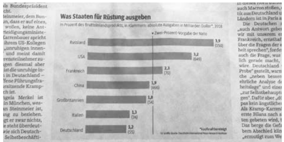
Süddeutsche Zeitung am Samstag (Ausgabe vom 15./16.2.20)