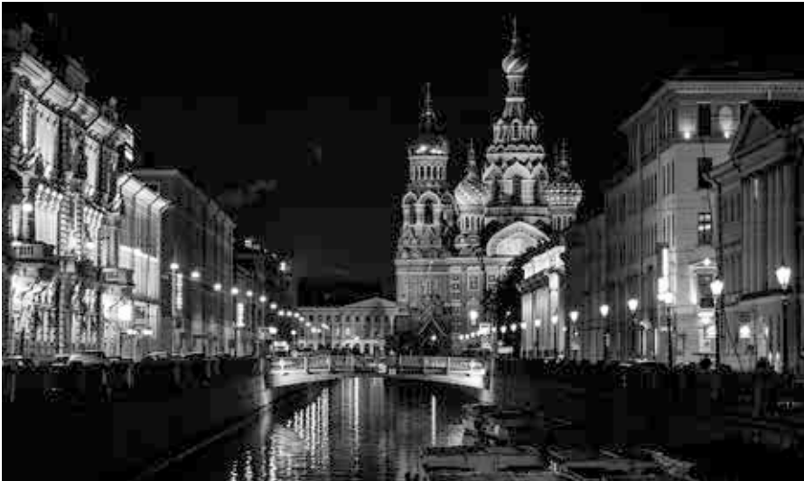
Petersburg bei Nacht. Quelle: https://pxhere.com/de/photo/842983 , Foto: Pxhere, Lizenz: CC-0

archie und des Chaos. Es gab bittere Armut in der Bevölkerung. Keiner ging zur Polizei, wenn etwas passierte, denn die Polizei war korrupt und hat die Menschen noch zusätzlich ausgeraubt. Es kam vor, dass man nachts auf der Straße von Polizisten angehalten und durchsucht wurde. Nach der Durchsuchung bekam man sein Portemonnaie immer leer zurück. Wir haben unser Geld immer in den Strümpfen versteckt und nur kleine Beträge im Geldbeutel behalten. Die Streifenpolizisten haben jeden nach Gusto angehalten – sie haben aber ja auch nichts verdient, konnten von ihrem Gehalt nicht leben. Damals ging folgender Witz um: „Ein Autofahrer wird angehalten und beschwert sich, dass er doch gar nicht zu schnell gefahren sei. Die Antwort des Polizisten lautet: Meine Kinder haben heute Hunger und können nicht warten, bis Du zu schnell fährst.“