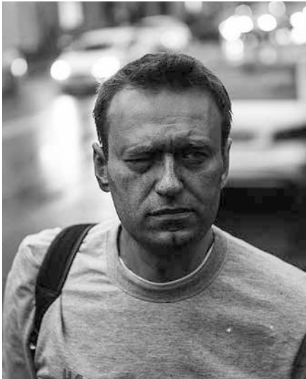
Alexei Anatoljewitsch Nawalny ist ein russischer Rechtsanwalt und führender oppositioneller Aktivist.

seit den Zaren immer ein korruptes Land. Und wie will man mit einem korrupten Beamtenapparat einen korrupten Beamtenapparat bekämpfen? Das ist ein langer gesellschaftlicher Prozess, da ja auch diejenigen profitieren, die die Beamten bestechen. Es ist angenehmer, für 50 Euro nur eine Stunde statt einen Monat auf eine Genehmigung zu warten. Aber die Fortschritte sind sichtbar. Die alltägliche Korruption auf der Straße ist vorbei. Die Beamten sind sehr vorsichtig geworden. Und mit der Digitalisierung der Behörden hat Russland jetzt einen Weg gefunden, die Korruption weiter zurückzudrängen, denn es wird schwer, für etwas „im Hinterzimmer“ Schmiergeld zu nehmen, wenn alles online und transparent geschieht. Man geht mit Riesenschritten an die Digitalisierung der Verwaltung. Aber ja, die Korruption ist noch ein großes Problem in Russland.