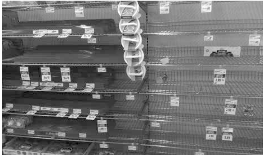
Leere Regale in einem Supermarkt.

Damit war Präsident Putin endgültig nicht mehr Everybody's Darling im Wes-