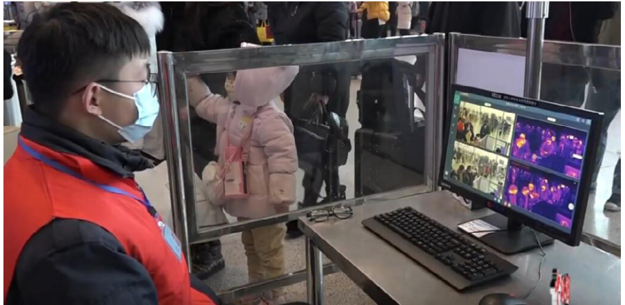
China testet alle auf Corona-Symptome

Die wissenschaftlichen Erkenntnisse zum Coronavirus sind noch nicht abgeschlossen. Vollständige Daten sind nicht vorhanden, und wegen der Komplexität und der unbekannt, beteiligten Faktoren sollten alle wissenschaftlichen Ergebnisse als vorläufig betrachtet werden. Die meisten harten Schätzungen der Anzahl der Infizierten und Toten werden zwangsläufig nicht korrekt sein [3]. Sie werden wahrscheinlich eher den unteren Bereich dessen, was passiert, abbilden, die ganze Wahrheit ist zu diesem Zeitpunkt unbekannt, kann aber abgeschätzt werden, wenn auch mit großen Ungenauigkeiten. Viele Studien werden ohne Gutachten anderer Experten herausgegeben, um eine schnelle Veröffentlichung zu ermöglichen, aber selbst jene, die eine Begutachtung durch