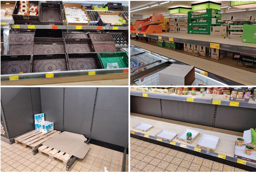
Erhöhte Nachfrage nach Produkten wie Obst, Reis, Lebensmittelkonserven und Toilettenpapier infolge der COVID-19-Pandemie, aufgenommen in einem Discounter in Baden-Württemberg.

Chinas Produktionsleistung ist dramatisch zurückgegangen, was ganz klar zeigt, wie massive Eindämmungsmaßnahmen die wirtschaftlichen Aktivitäten im Gegenzug beschnitten haben. Während das Ausmaß des Coronavirus-Ausbruchs in den USA, in Europa und in Großbritannien immer deutlicher wird, werden Eindämmungsmaßnahmen drastische Folgen für die Wirtschaftsaktivität bringen, wenn Unternehmen schließen und andere vorbeugende Maßnahmen ergreifen. Wir können davon ausgehen, dass die Inlandsproduktion mindestens über die sechs nächsten Monate hinweg deutlich sinken wird.