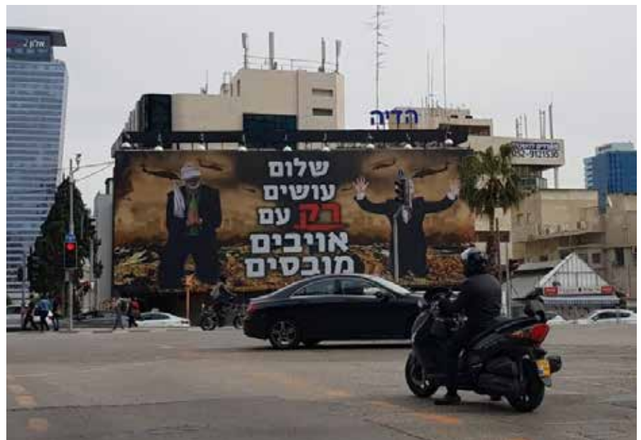
Eine provozierende Anzeige von PA-Präsident Mahmoud Abbas und Hamas-Führer Ismail Haniyeh, die sich scheinbar dem israelischen Militär ergeben, war am Freitag, 14. Februar 2020, in Tel Aviv zu sehen. Es war nicht sofort klar, wer die Werbetafeln rund um Tel Aviv, die Finanzhauptstadt Israels, finanzierte und ob diese Kampagne den rechten Parteien bei den nationalen Wahlen am 2. März helfen sollte.

Dort wurden in den letzten Tagen riesige Plakatwände aufgehängt, auf