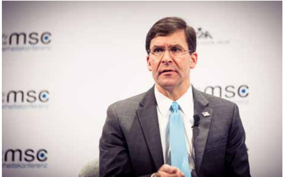
Dr. Mark T. Esper sprach auf der Münchner Sicherheitskonferenz über die Bedrohung aus China.

Wie in Libyen, das bis 2011 unter dem furchtbaren Diktator Muammar al Gaddafi das afrikanische Land mit dem höchsten Lebensstandard in Afrika war, mit kostenloser Gesundheitsversorgung und Bildung, auch für Frauen. Bis der Wertewesten die Libyer von ihrem Wohlstand befreite und ihnen die Freiheit brachte, von mindestens zwei Regierungen