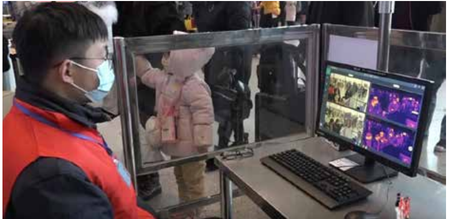
China testet alle auf Corona-Symptome

Die wissenschaftlichen Erkenntnisse zum Coronavirus sind noch nicht abgeschlossen. Vollständige Daten sind nicht vorhanden, und wegen der Komplexität und der unbekannteren, beteiligten Faktoren sollten alle wissenschaftlichen Ergebnisse als vorläufig betrachtet werden. Die meisten harten Schätzungen der Anzahl der Infizierten und Toten werden zwangsläufig nicht korrekt sein [3]. Sie werden wahrscheinlich eher den unteren Bereich dessen, was passiert, abbilden, die ganze Wahrheit ist zu diesem Zeitpunkt unbekannt, kann aber abgeschätzt werden, wenn auch mit großen Ungenauigkeiten. Viele Studien werden ohne Gutachten anderer Experten herausgegeben, um eine schnelle Veröffentlichung zu ermöglichen, aber selbst jene, die eine Begutachtung durch