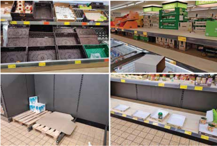
Erhöhte Nachfrage nach Produkten wie Obst, Reis, Lebensmittelkonserven und Toilettenpapier infolge der COVID-19-Pandemie, aufgenommen in einem Discounter in Baden-Württemberg.

Chinas Produktionsleistung ist dramatisch zurückgegangen, was ganz klar zeigt, wie massive Eindämmungsmaßnahmen die wirtschaftlichen Aktivitäten im Gegenzug beschnitten haben. Während das Ausmaß des Coronavirus-Ausbruchs in den USA, in Europa und in Großbritannien immer deutlicher wird, werden Eindämmungsmaßnahmen drastische Folgen für die Wirtschaftsaktivität bringen, wenn Unternehmen schließen und andere vorbeugende Maßnahmen ergreifen. Wir können davon ausgehen, dass die Inlandsproduktion mindestens über die sechs nächsten Monate hinweg deutlich sinken wird.