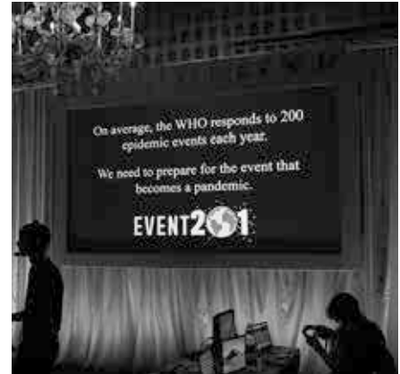
Hintergrund-Banner der Veranstaltung „Events201“: Im Durchschnitt reagiert die WHO auf 200 epidemische Ereignisse pro Jahr. Wir müssen uns auf das Ereignis vorbereiten, das zu einer Pandemie wird. Event 201.

In Wuhan fand zwei Wochen vor dem Ausbruch von COVID 19 vom 18.-27. November eine Militärolympiade statt,