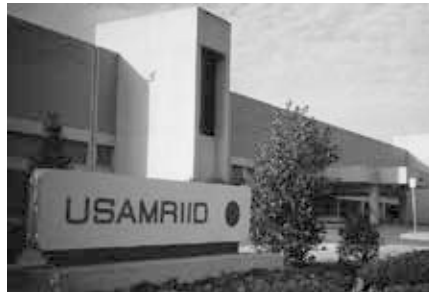
Das „Dan Crozier Building“ des USAMRIID, Fort Detrick, Maryland.

gesorgt worden. Die Nachrichtenlage der Mainstreammedien ist von keinem Zweifel getrübt.