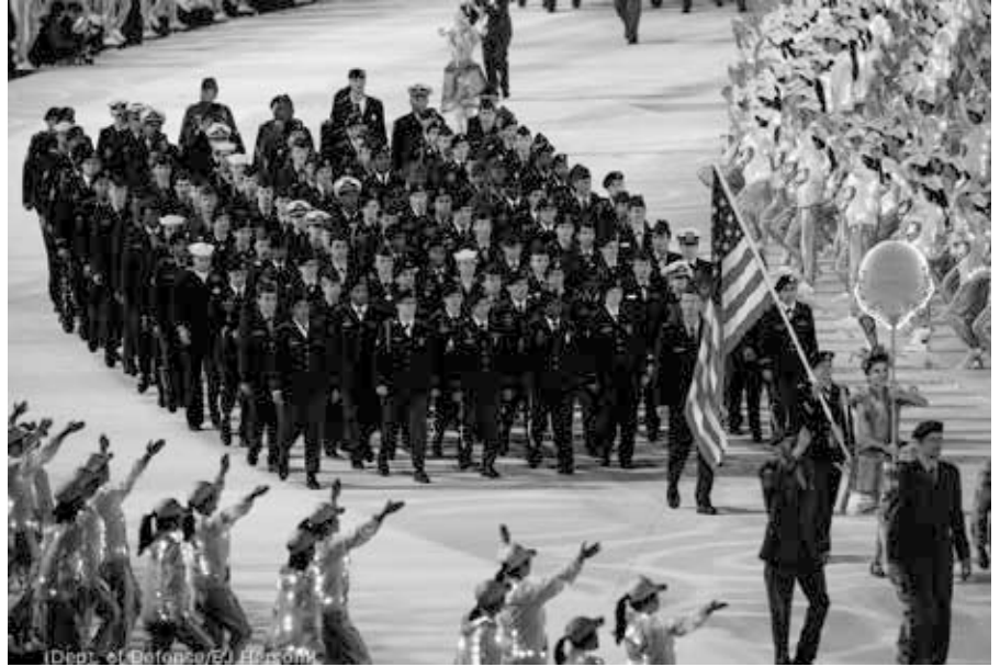
Das Sportteam der US-Streitkräfte marschiert bei der Eröffnungszeremonie für die militärischen Weltspiele 2019 in Wuhan, China.