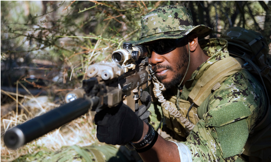
United States Navy SEALs.

Haushaltsjahr 2018 hatte das US-Verteidigungsministerium den Menschen draußen im Lande mitgeteilt, die steuerliche Belastung durch die auswärtigen Kriege gegen den Terror weltweit betrage für jeden US-Bürger in jenem Jahr genau 7.623 Dollar. Das ist schon krass genug. Jedes Jahr für Kriege in Ländern, deren genaue Lage kaum ein US-Bürger benennen kann, ganz zu schweigen von den genauen Gründen, warum US-Soldaten dort hochbewaffnet agieren müssen, so viel auszugeben wie für einen gebrauchten Mittelklassewagen, ist schon schwer genug zu vermitteln.