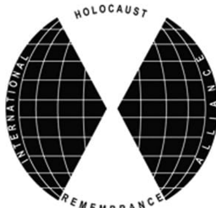
Logo der International Holocaust Remembrance Alliance. Quelle: https://de.wikipedia.org/wiki/Datei:IHRA_Logo.png , Foto: Wikipedia / Laurakay1986, Lizenz: CC BY-SA 4.0

Auch Deutschland gehört der IHRA an und so ist es kein Wunder, dass die Bun-