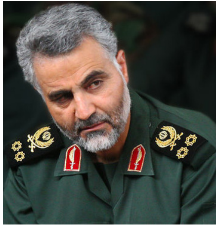
Qasem Soleimani-Kommandeur der Quds Force der Armee der Wächter der Islamischen Revolution (IRGC). Quelle: https://de.m.wikipedia.org/wiki/Datei:Sardar_Qasem_Soleimani-01.jpg , Foto: Wikipedia / akkasemosalman.ir, Lizenz: CC BY 4.0 Bild 4 : iran-3854254_1280.jpg

Das letztendliche Ziel ist, Shanghai mit dem östlichen Mittelmeer zu verknüpfen – auf dem Landweg, über das Herzland.