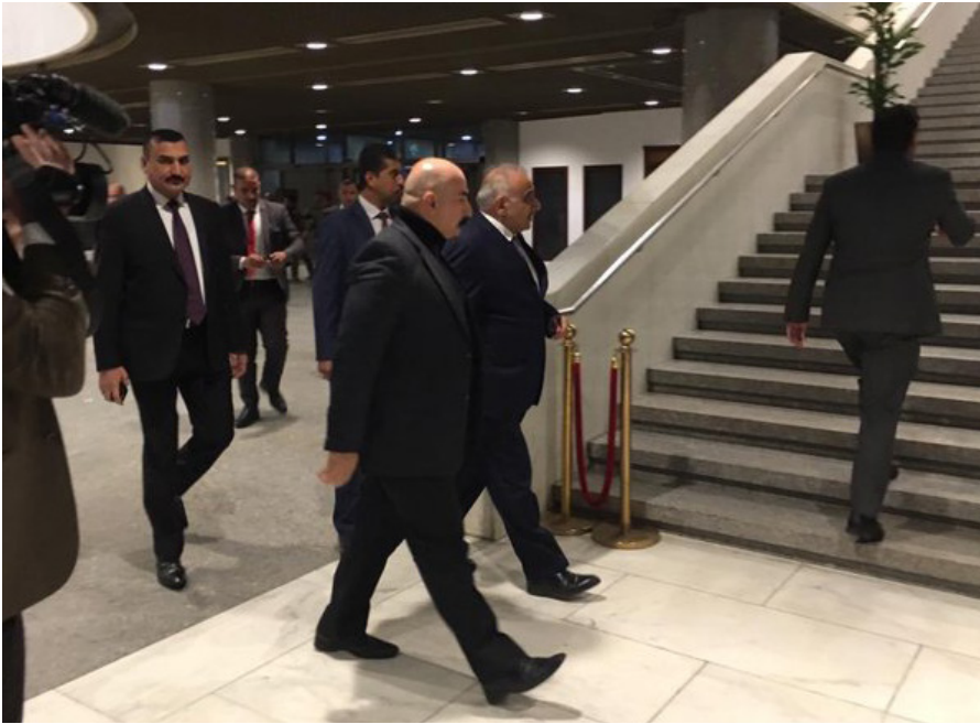
Der irakische Premierminister Adil AbdAl Mahdi (Mitte hinten) ist im Parlament angekommen, um an der Sitzung teilzunehmen.

Abdul-Mahdi sagte, Trump habe ihm persönlich für seine Bemühungen gedankt [7], während dieser bereits den Anschlag auf Soleimani plante – und damit den Eindruck erweckt hatte, der iranische General könne sicher nach Bagdad reisen.