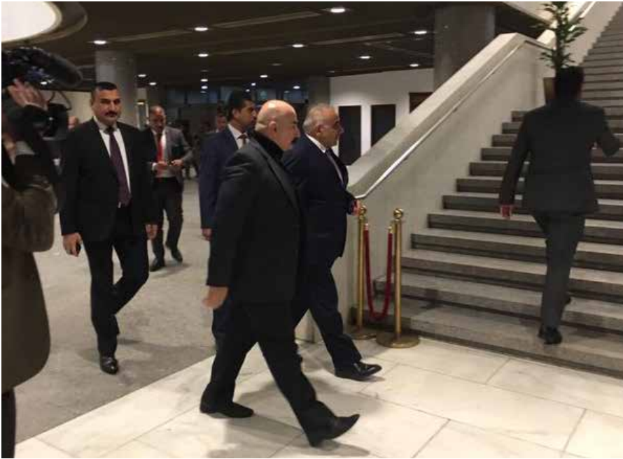
Der irakische Premierminister Adil AbdAl Mahdi (Mitte hinten) ist im Parlament angekommen, um an der Sitzung teilzunehmen.

Abdul-Mahdi sagte, Trump habe ihm persönlich für seine Bemühungen gedankt [7], während dieser bereits den Anschlag auf Soleimani plante – und damit den Eindruck erweckt hatte, der iranische General könne sicher nach Bagdad reisen.